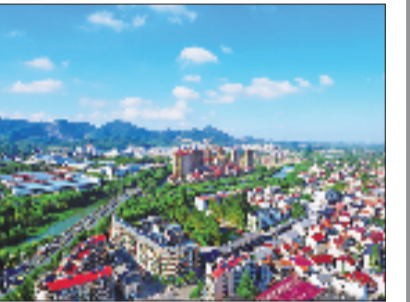
俯瞰埭溪镇

下一步,埭溪镇将持续深耕清廉乡村建设,不断完善基层监督体系,厚植清廉文化底蕴,擦亮清廉治理品牌,以清风正气护航乡村全面振兴,让和美乡村兼具生态颜值、产业价值和清廉底色,在青山绿水间徐徐铺开一幅生态美、产业兴、百姓富的共同富裕新画卷。