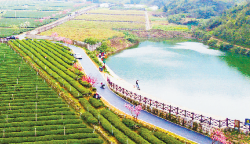
全链提质增效，茶香铺展富民路。

为了进一步巩固产业发展根基，越城区设立“越韵农臻”专项发展资金，统筹省、市农业产业化扶持资金与社会资本，同时创新推出12类政策性农业保险，2025年各级财政保费补贴862.41万元，年风险保障额度超3.74亿元，为产业发展筑牢“防护网”。 从单一种养到全链融合，越城区持续拓展土特产的价值边界。总投资22.7亿元的黄酒产业园已落地建设，将打造集生产、研发、物流、文旅于一体的产业平台；总投资10亿元的抹茶产业园正加紧规划，未来将建成交易仓储中心、数字化工厂与新场景体验空间。全区已建成产地冷链设施9家，库容0.75万立方米，农业数字工厂、数字牧场等新业态蓬勃发展，产业链韧性不断增强。