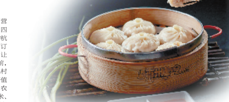
从工坊到市场，嵊州小笼全链发展。

作为传统农业大县，嵊州紧扣缩小“三大差距”“扩中提低”核心任务，依托本土资源禀赋，深耕土特产全产业链体系，构建梯次化产业发展格局，推动特色农业向规模化、高端化升级。 如今，当地已形成层级清晰的特色产业集群，小笼包产业产值突破百亿元，茶叶产业产值超50亿元，粮食、蚕桑等多条产业产值均超10亿元，建成3条十亿级以上农业全产业链。 产业提质增效是助农增收、夯实共富根基的核心关键。嵊州聚焦乡村产业升级、技术创新、基地提质，全面盘活乡村可用资源，赋能农业高质量发展。当地大力推广“轮作、间作、共生”等高效种养模式，打造多个省级标准化农业基地，稻渔共生、粮菜轮作等新模式实现亩均增收超万元。同时，当地深耕精深加工，配套小笼包产业推行订单化精准生产，配套小笼包产业建设专属小葱种植基地，日均供应企业小葱5吨以上，有效吸纳农村剩余劳动力就地就业。目前，全市已建成177个