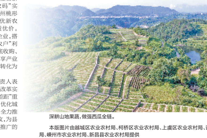
深耕山地果蔬，做强西瓜全链。

小京生花生、山地猕猴桃、水蜜桃、淡水鱼、中药材六大特色品类协同联动、互补发展的现代农业全产业链体系。其中，新昌溪谷产业通过联动高校开展产学研技术攻关，建成全国规模最大的光导鱼繁育基地，年产量超1亿尾，带动3000余户农户从业，户均年增收1.5万元。拥有千年种植历史的中药材产业同步提质升级，“雷公藤全产业链”入选全省中药材共富模式案例，仿野生白术种植亩产效益突破9000元，预计2030年全县中药材全产业链总产值可达2.5亿元。