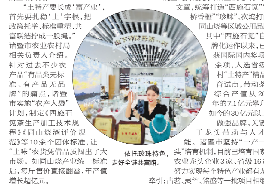
依托珍珠特色，走好全链共富路。

与与此同时，诸暨市以和美共富片区建设为载体，联合建成“土特产”共富工坊130家、社区“共富工坊”直营店8家，搭建“田间地头—城市餐桌”的直通车，为村集体经济增收3000余万元，让“土特产”真正成为农户门口的“增收袋”。 跳出同质化竞争，诸暨锚定“特”字做文章，统筹打造“西施石斑”“枫桥香榧”“珍珠”“次坞打面、同山烧等区域公用品牌，其中“西施石斑”品牌化运作以来，已斩获国际国内奖项30余项，入选省级乡村“土特产”精品培育试点，带动茶叶综合产值从2019年的7.1亿元攀升至如今的30亿元以上。