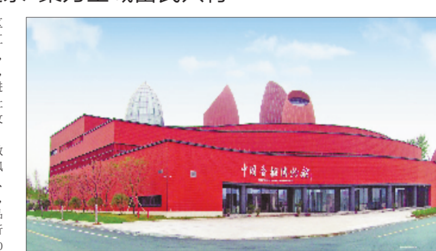
展千年稻韵风华，兴全链共富产业。

作为传统农业大县，嵊州紧扣缩小“三大差距”“扩中提低”核心任务，依托本土资源禀赋，深耕土特产全产业链体系，构建梯次化产业发展格局，推动特色农业向规模化、高端化升级。 如今，当地已形成层级清晰的特色产业集群，小笼包产业产值突破百亿元，茶叶产业产值超50亿元，粮食、蚕桑等多条产业产值均超10亿元，建成3条十亿级以上农业全产业链。 产业提质增效是助农增收、夯实共富根基的核心关键。嵊州聚焦乡村产业升级、技术创新、基地提质，全面盘活乡村可用资源，赋能农业高质量发展。当地大力推广“轮作、间作、共生”等高效种养模式，打造多个省级标准化农业基地，稻渔共生、粮菜轮作等新模式实现亩均增收超万元。同时，当地深耕精深加工，配套小笼包产业推行订单化精准生产，配套小笼包产业建设专属小葱种植基地，日均供应企业小葱5吨以上，有效吸纳农村剩余劳动力就地就业。目前，全市已建成177个