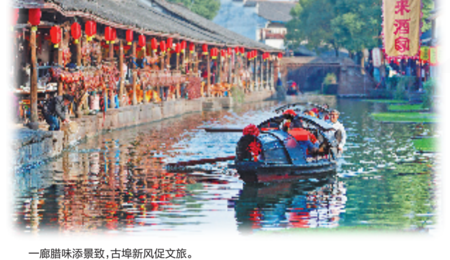
一艘船味添景致，古埠新风促文旅。