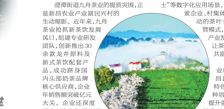
链动农特产，跑出共富加速度。

近年来，新昌立足山区资源禀赋，紧扣“缩小城乡差距、促进共同富裕”主线，以“三理念一支撑”为引领，推动特色产业向标准化、规模化、现代化转型，持续激活乡村共富新动能。 澄潭街道九舟茶业的提质突围，正是新昌农业产业富民兴村的生动缩影。近年来，九舟茶业抢抓新茶饮发展机遇，创新推出30余款龙井原料及新式茶饮套餐产品，成功跻身国内头部奶茶品牌核心供应商，企业年销售额突破亿元大关。企业还深度联动本地茶农，签订覆盖5万亩茶园的合作订单，累计带动一万余名茶农增收超3000万元，让一片小小茶叶，成为带动群众稳定增收出共富加速度。