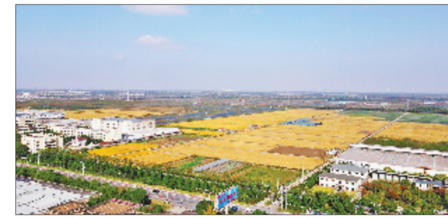
杭州湾上虞良种繁育基地

自主培育的超级稻“舜达136”良种覆盖率超98%；茶叶无性系良种化率将在2027年达85%；“四季仙果”先后引种“金霞油蚶”等11个优质新品种。通过农业“双强”行动，数字化茶园、智慧渔场、高标准农田遍布城乡，从源头筑牢优质农产品根基。 针对鲜果“旺季烂、淡季断”的痛点，上虞以“坊片链”模式系统布局，将季节性压力转化为产业纵深发展的持续动力。虞之梦鲜果深加工、抹茶精加工等项目相继落地，杨梅酒、抹茶点等产品拉长了价值链，有效提升了农产品的附加值与市场竞争力。岭南乡“榴后·PU至”共富片区，青山环抱的6个行政村共享发展红利，年旅游营收突破6500万元。深加工与农文旅融合的双轮驱动，共同勾勒出上虞“坊片链”融合模式的生动图景。