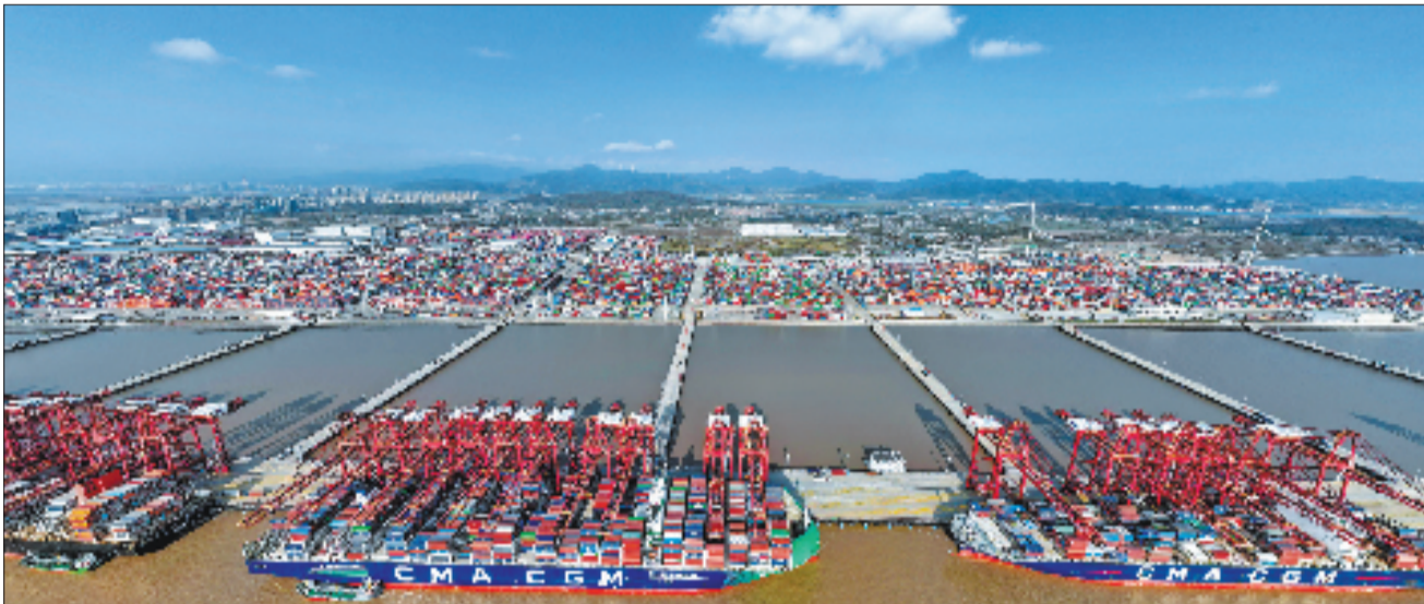
2025年12月,货轮在宁波舟山港梅山港区装卸货物。作为全球货物吞吐量第一的超级大港,宁波舟山港在服务全国统一大市场建设中发挥着重要作用。

开会议,强调要纵深推进全国统一大市场建设,深入整治“内卷式”竞争。“内卷式”竞争的成因是什么?全国统一大市场为何能破局“内卷式”竞争?