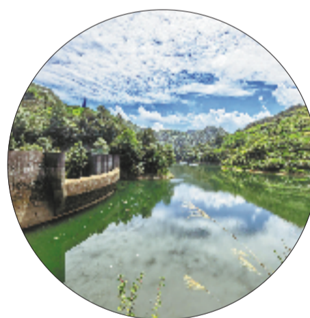
创新“取水贷”融资模式，探索生态价值转化新路径。

丽水被誉为“中国水电第一市”，一些小水电站面临“资源难变资产”的困境。杭州银行丽水分行主动嵌入地方“取水贷”融资模式，截至目前已为6家小水电站