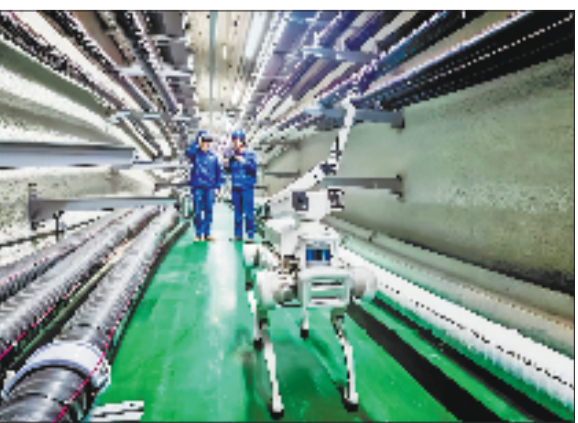
围绕“415X”先进制造业集群建设，以金融之力撬动新质生产力蓬勃发展。

下一批“小龙”“骏马”在哪里？答案或许就藏在今天那些尚未被市场叫出的名字里。而杭州银行正从区位深耕到战略布局，将金融资源转化为科技创新的源头活水。