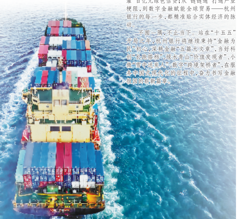
破浪出海正当时，以金融之翼托举企业远航新征程。

不固一隅，不止当下。站在“十五五”开局之年，杭州银行将继续秉持“金融为民”初心，深耕金融“五篇大文章”，当好科创“长跑搭客”、绿水青山“价值发现者”、小微“雪中送炭人”、数字“跨境架桥者”，在服务中国式现代化的征程中，奋力书写金融报国的崭新篇章。