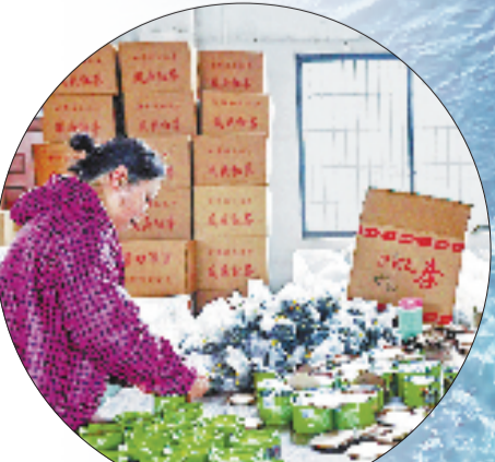
金融润茶产业，链上赋能促共富。

截至2025年末，该行普惠型小微企业贷款余额1821.13亿元，民营企业贷款余额2977.40亿元。一条有温度、有力度的普惠之路，正越走越宽。