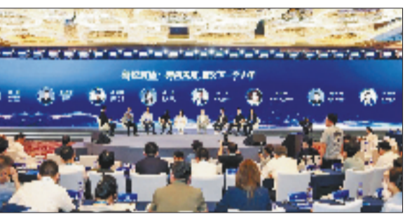
深耕科创沃土，引金融活水浇灌科技繁花。

“十五五”规划提出加快建设金融强国。杭州银行锚定“客户、效益、规模”三维目标，推进“流量化、数智化、国际化”三化经营，在服务实体经济中持续践行金融使命担当。