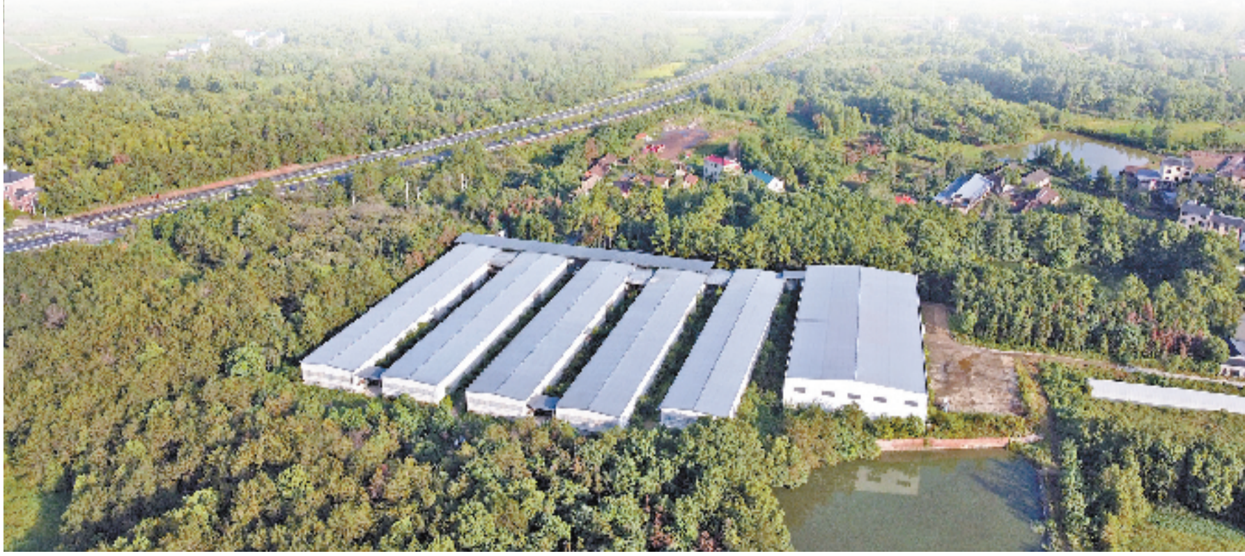
20万羽智能化高品质青年鸡养殖基地建设项目