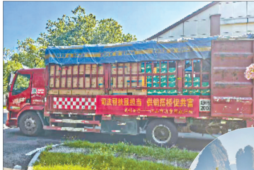
省司法厅——江山市消费帮扶行动

发展，江山提出了打造“全国输配电强县”的目标。但龙头企业不多、中小企业创新受限，一直是产业发展的瓶颈。