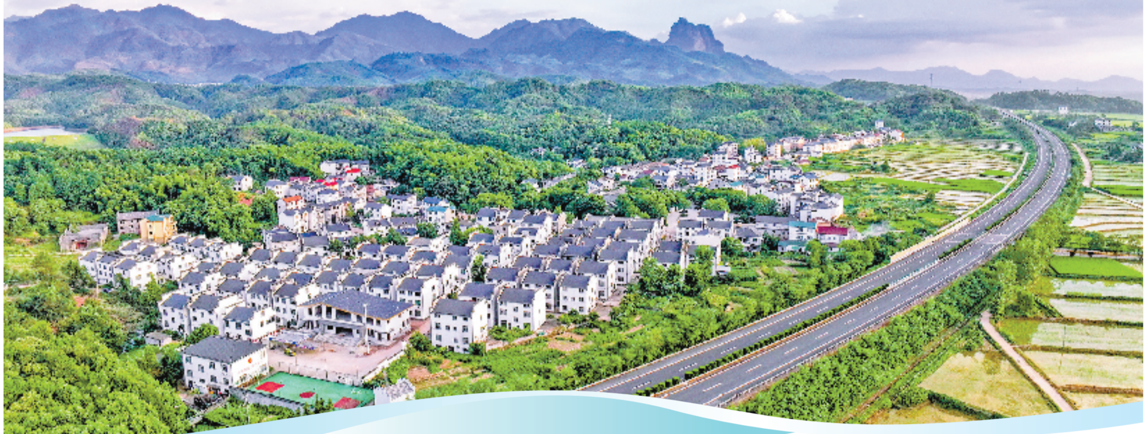
“一核引领、十村联动”的片区组团模式带动江山市石门镇乡村面貌焕然一新。

“看到”二字，是对帮扶工作的要求，也是对成效的期许。从慈善到产业，从医疗到法治，这张帮扶网络覆盖了江山发展的方方面面。17家团组单位，正在从“各自为战”走向“攥指成拳”。