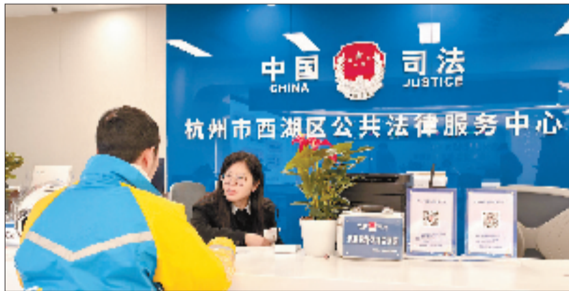
在西湖区公共法律服务中心,法律援助律师为外卖小哥提供法律咨询。

“太有用了,正好解答了我最近的烦恼。”讲座后,一名学生的感慨道出了许多人的心声。从具体案例切入,用身边事解读法条,这场讲座的目的不是灌输知识,而是赋予能力——让青年学子