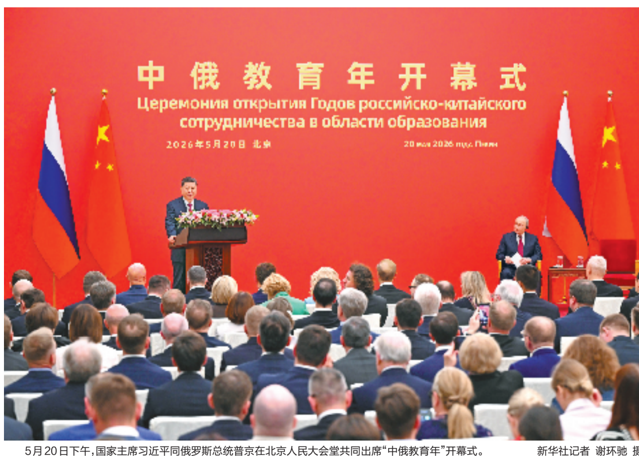
5月20日下午，国家主席习近平同俄罗斯总统普京在北京人民大会堂共同出席“中俄教育年”开幕式。

新华社北京5月20日电（记者杨依军 温馨）5月20日下午，国家主席习近平同俄罗斯总统普京在北京人民大会堂共同出席“中俄教育年”开幕式。 两国元首在热烈的掌声中一同步入会场。 习近平首先发表致辞。习近平指出，今年是中俄战略协作伙伴关系建立30周年和《中俄睦邻友好合作条约》签署25周年。在这样一个具有特殊意义的年份启动“中俄教育年”，是我和普京总统着眼中俄关系长远发展作出的战略部署。教育是国与国之间连接民心、传承友谊的重要桥梁，是功在当代、利在千秋的崇高事业。长期以来，中俄教育合作持续深化、成效明显，丰富了中俄新时代全面战略协作伙伴关系的内涵。以“中俄教育年”为契机，双方要进一步凝聚合作共识、拓展合作领域、提升合作水平。 习近平强调，教育兴则国家兴，教育强则国家强。中俄要深化人才培养合作，共同培育国际顶尖人才队伍和国家战略科技力量，携手攻克前沿科学难题，助力两国创新发展；要践行文明互鉴理念，推动文明传承和教育治理经验交流，共同提高工作水平；要赓续传统友好情谊，进一步释放教育合作潜力，促进两国民众相知相亲，让青少年在深入交流中增进友谊，培育中俄世代友好的接班人。相信在双方共同努力下，“中俄教育年”