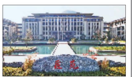
杭州第一技师学院临安校区

内涵式发展是职业教育高质量发展的必由之路。在加快构建具有浙江特色的现代职业教育体系的新征程上,杭州第一技师学院坚守技能育人初心,深耕产教融合,让金鹰品质与匠心精神在之江大地熠熠生辉。