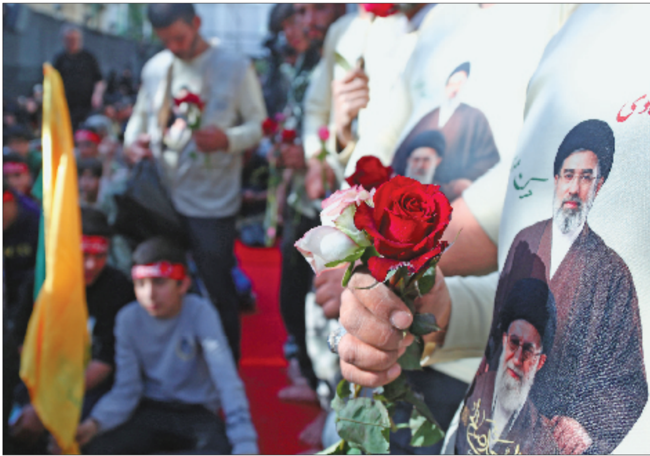
5月7日下午,大批民众在伊朗首都德黑兰集会,悼念已故最高领袖哈梅内伊,誓言效忠现任最高领袖穆杰塔巴·哈梅内伊。

按照美国《华尔街日报》和卡塔尔半岛电视台说法,伊朗还提议在第二阶段的30天内就核问题展开谈判。伊方表示,愿意暂停铀浓缩活动,暂停年限