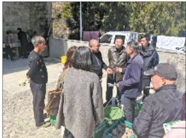
工行金华分行走进磐安厂村助力乡村振兴