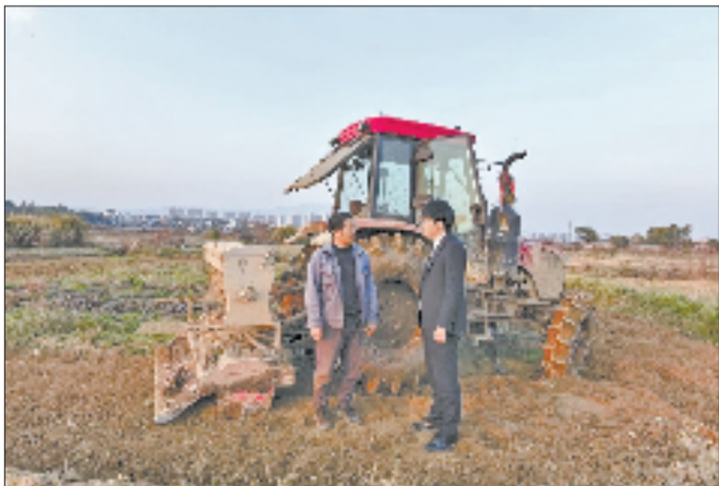
金华银行走进白龙桥镇了解村民需求