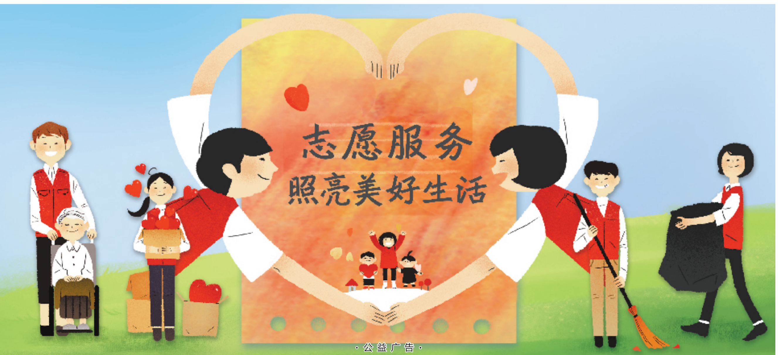
· 公益广告 ·

照明无人机为地震灾民点亮黑夜,医疗无人机为患者抢出时间,这都是科技向善、科技为人的绝佳示范。无人机的摄像头比人的视野看得更广、更清晰,但如果背后的使用者看不到他人的生计,他人的利益,没有把人的生存和发展放在优先考虑,那么发达的科技,照见的只会是落后的管理和治理理念。