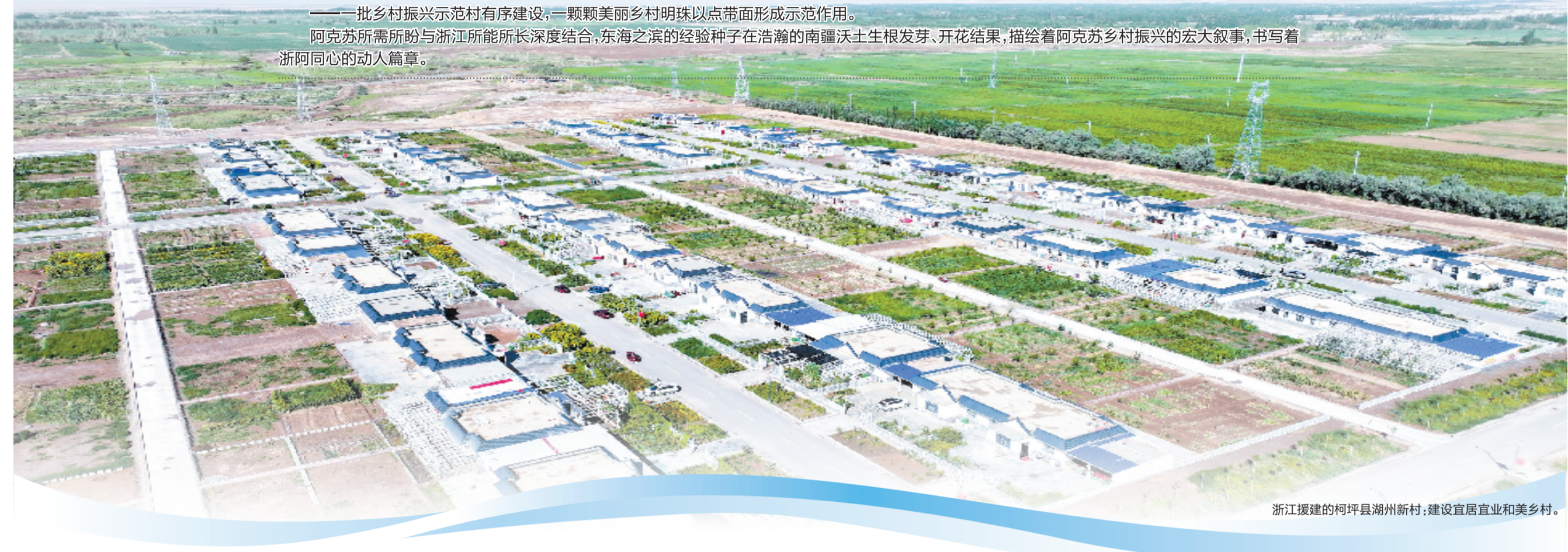
浙江援建的柯坪县湖州新村：建设宜居宜业和美乡村。

阿克苏所需所盼与浙江所能所长深度结合，东海之滨的经验种子在浩瀚的南疆沃土生根发芽、开花结果，描绘着阿克苏乡村振兴的宏大叙事，书写着浙阿同心的动人篇章。