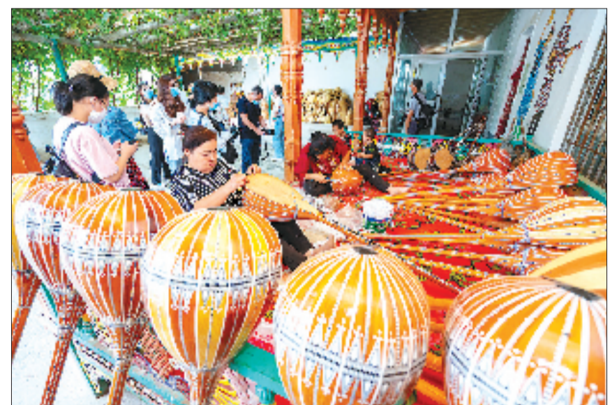
浙江援建的新和县天籟加依村：一把非遗琴带动一个村。

乡村振兴正当时，浙阿情深跨山海。2025年，“千万工程在阿克苏”专项行动被列入地区十大民生实事，成为推动当地乡村振兴的重要抓手。浙江援疆正以“千万工程”经验为指引，持续深化专项行动，加快描绘生产、生活、生态“三生融合”的阿克苏乡村发展新图景，为做活做强南疆棋眼、铸牢中华民族共同体意识书写时代注解，不断描绘援疆工作高质量发展、浙阿同心共筑美好家园的崭新篇章。