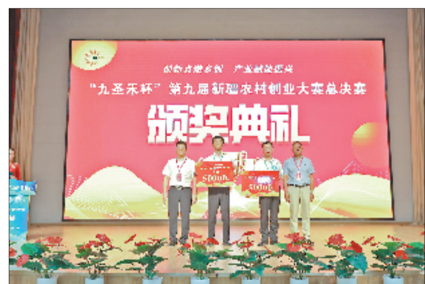
浙江援建的温宿县帕克勒克村：乡村运营获第九届新疆农村创业大赛一等奖。