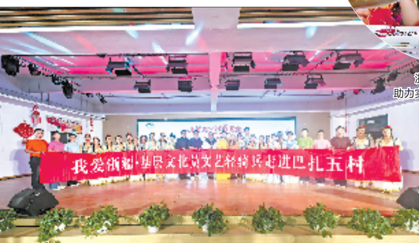
我爱浙疆·基层文化员文艺轻骑兵走进阿克苏乡村