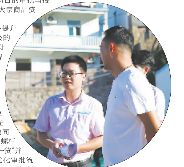
农行嵊泗县支行走访民宿主

潮涌东海，奋楫者先。农行舟山分行将继续秉持“金融为民”的初心，以敢为人先的创新锐气、求真务实的为民情怀，持续深耕这片蓝色沃土，不断拓宽金融服务的广度和深度，为舟山高水平建设现代海洋城市、谱写中国式现代化浙江新篇章贡献更大的农行力量。