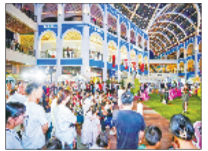
杭州首创奥特莱斯

“以‘景园村’深度融合为牵引，东洲街道正着力串联富春江（北支江）南北两岸文旅消费资源，深度链接主城区发展脉络，全面提升城市能级与品质内涵。”东洲街道主要负责人表示，当前，科海路南延工程、东望路道路提级、中桥路优化改造等一批基础支撑项目正加快推进，2026年“ICP世界龙舟锦标赛”等国际赛事亦将密集登场。这些重大项目与国际赛事协同发力，将进一步加速东洲街道“融城接廊”步伐，高水平描绘宜游、宜居、宜业的新时代东洲新画卷，为富阳高水平打造富裕阳光的现代化新型城区和加快建设“一图一区五地”注入澎湃动能。