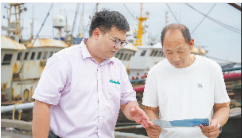
农行岱山县支行向渔民介绍“马力贷”产品和政策