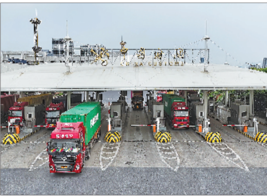
4月9日,集卡车在义乌港海关监管场所完成施封出场。

“新平台实现了自动放行,哪怕是半夜需要赶船期的货柜,也能及时处理,对货代和外贸公司来说方便多了。”义乌市甬越报