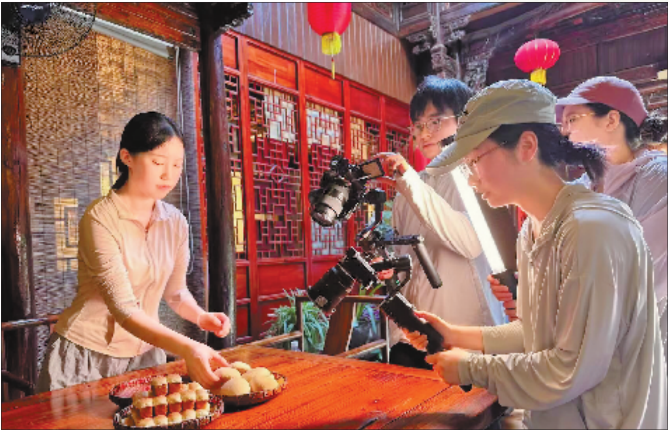
浙江外国语学院学生在衢州杜泽老街拍摄非遗短片《记得》。

冬天是香菇旺产期。这天,为感谢长期扎根菇棚一线“科技小院”的同学们,庆元大坑村的菇农亲自掌勺,做了一