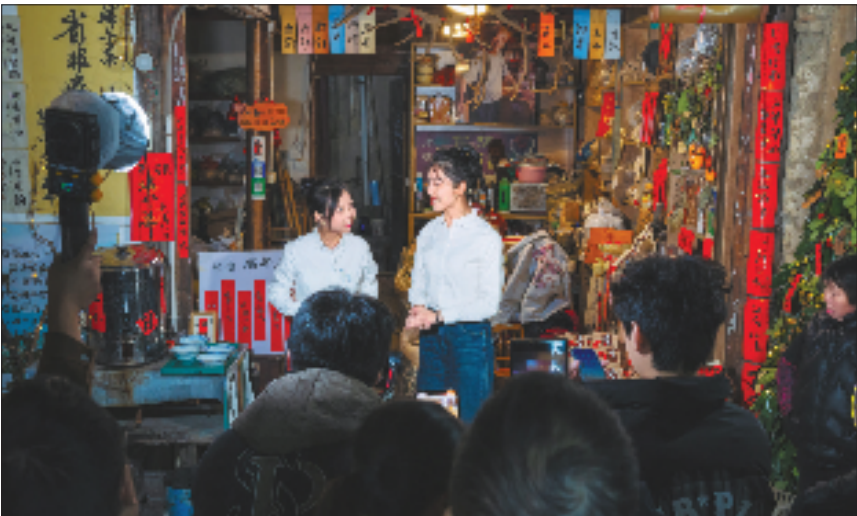
浙江农林大学师生在丽水松阳老街开展“秘境寻声”快闪微宣讲。