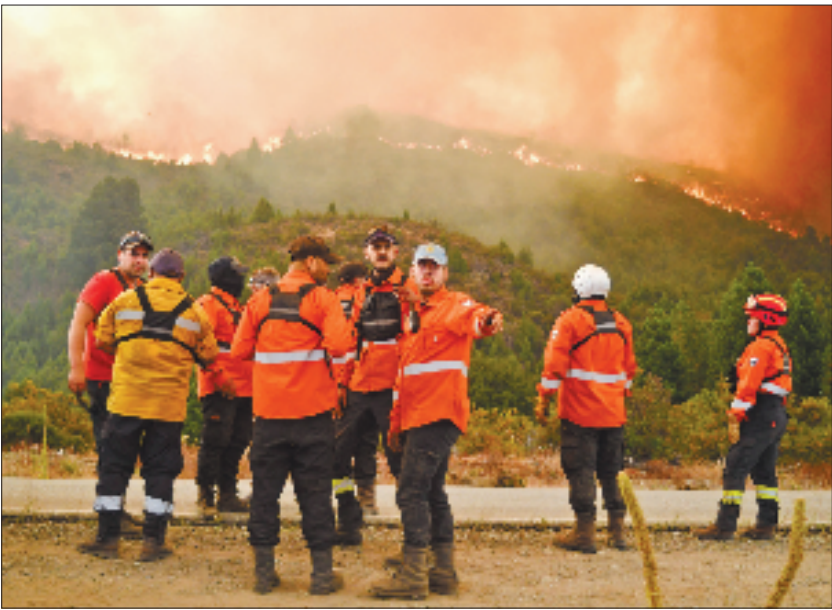
2月1日，在阿根廷巴塔哥尼亚地区丘布特省齐利拉，民防人员参与灭火。1月29日，阿根廷政府宣布巴塔哥尼亚地区因野火肆虐进入紧急状态。