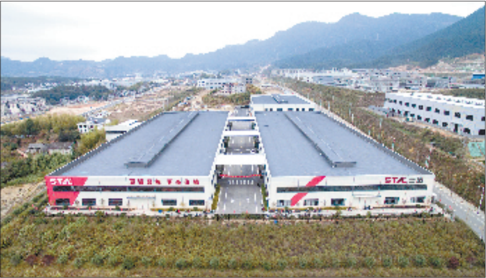
浙江三田汽车空调压缩机有限公司

多年来，龙泉不断完善“周五开门接访日”机制，推动信访工作从“事后处置”向“源头治理”转变。这一机制的建立并非偶然，而是基于龙泉对基层治理深层次矛盾的清醒认知——很多问题看似细小，但若长期积累、久拖不决，就可能演变为影响社会稳定的系统性风险。为此，龙泉主动破局，各级主要领导带头化身“接访员”，直面群众、直面问题。