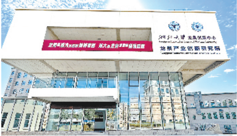
与浙江大学共建龙泉产业创新研究院

目前，龙泉已完成“房票换地票”1335植，开具“房票”667张，6个连片留用地处置陆续签约，房地产去化2.75万平方米，腾出用