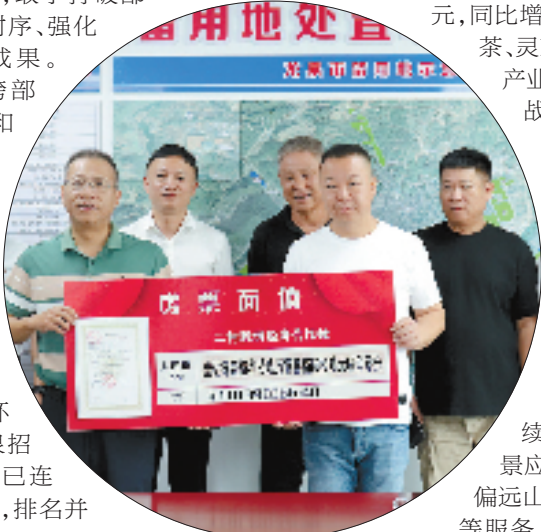
龙泉市创新开展“房票换地票”工作

《不动产权证书》《建设用地规划许可证》《建设工程规划许可证》《建筑工程施工许可证》“四证联发”正是龙泉瞄准企业投资兴业的痛点堵点，敢于打破部门界限、重组审批时序、强化靠前服务的创新成果。其背后是大量的跨部门协调、数据共享和流程再造工作，需要克服诸多制度性和技术性难题。龙泉以攻坚克难的勇气，将“不可能”变为“可能”，显著降低了企业制度性交易成本和时间成本。在营商环境无感监测中，龙泉招投标相关9项指标已连续26个月保持满分，排名并列全省第一。