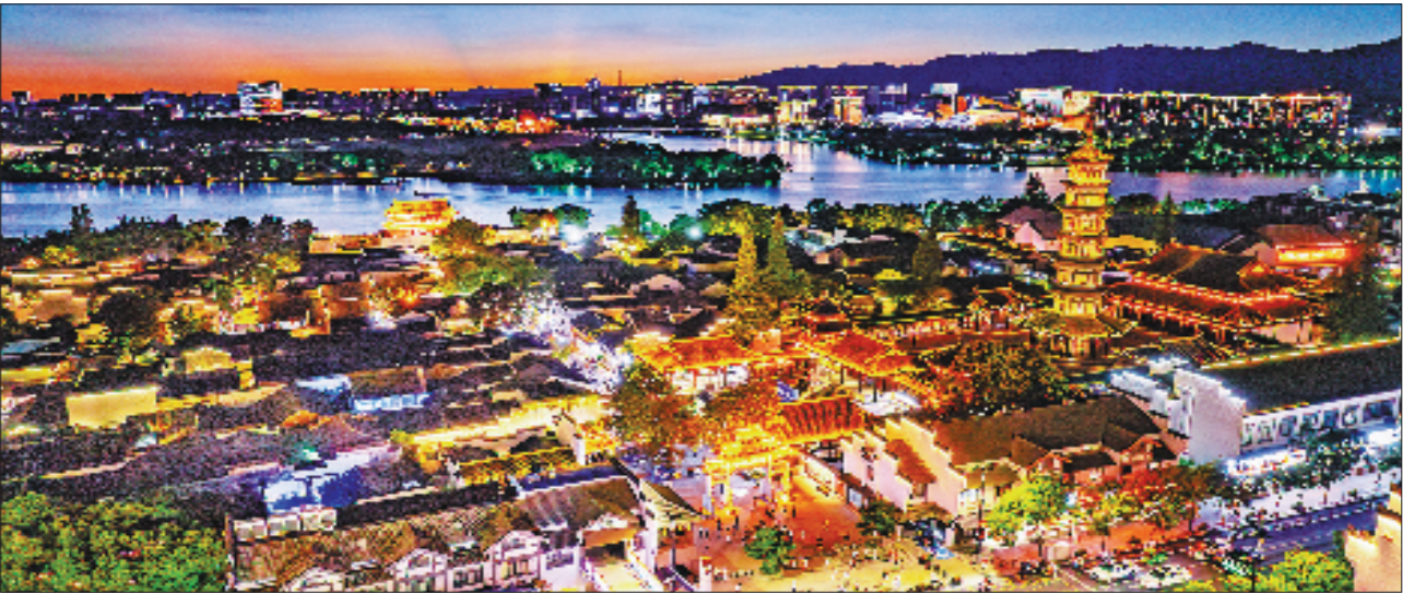
衢州古城文化旅游区

企业实现技术到产业优势的跨越，不仅需要创新引领，更需资金、服务、人才要素的系统赋能。在衢州“工业强市、产业兴市”战略指引下，柯城紧扣打造千亿级高端新材料与百亿级光电半导体产业集群目标，深入推进“五链”融合，打好招大引强和培大育