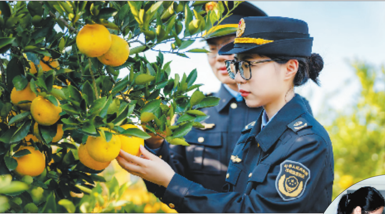
常山县市场监督管理局开展地理标志产品专项检查和抽检工作

为守护好这块金字招牌，当地严格管理专用标志。强化法治保障，出台《常山胡柚地理标志产品保护管理办法》《常山县人民代表大会常务委员会关于进一步加强常山胡柚地理标志保护的決定》等文件，积极推进《衢州市常山胡柚产业发展保护条例》立项论证，并纳入市人大2026年立法计划草案；坚持标准引领，推进《地理标志产品 常山胡柚》国家标准修订工作，依托县检验检测研究院强化全流程质量检测，为胡柚的生产、加工、质量检测等提供明确的标准依据；严格执法监管，建立常山胡柚地理标志溯源管理平台，印制溯源标识50万枚，实现“一箱一码一溯源”，开展地理标志产品专项检查和抽检工作。