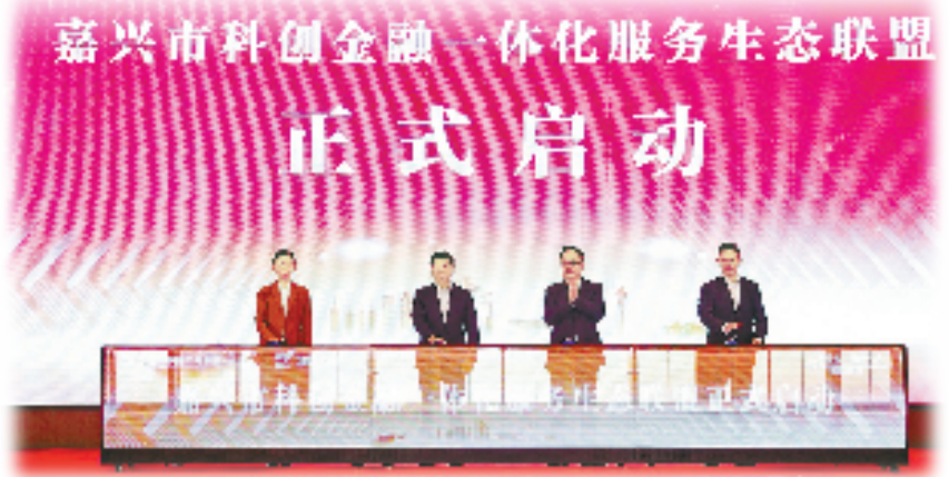
工行浙江省分行加快推进科技金融大生态建设，积极助力嘉兴市加快科创金融改革试验区建设。

作为扎根浙江的国有大行，工行浙江省分行紧扣省委、省政府战略部署，在近5年贷款净增超万亿元、总量翻番基础上，推动各项贷款突破2.2万亿元，2025年普惠、涉农、绿色贷款在系统内率先站上4100亿元、6500亿元和7000亿元高点，绿色贷款总量在同业和系统内均居首位。在支持共同富裕示范区建设、推动科技创新、促进绿色转型、深化对外开放、服务普惠民生等关键领域精准发力，高分做好“五篇大文章”，奏响金融报国、服务地方的时代强音。