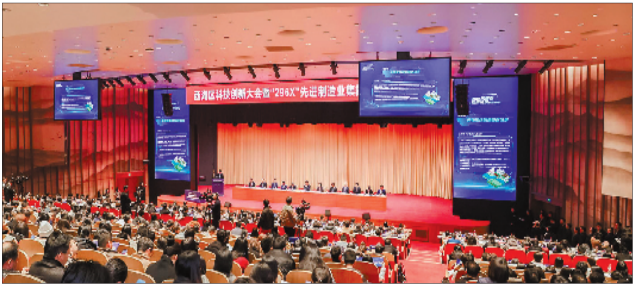
西湖区科技创新大会暨“296X”先进制造业集群建设推进会