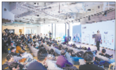
在“魔搭社区”，创客们的“头脑风暴”随时进行。