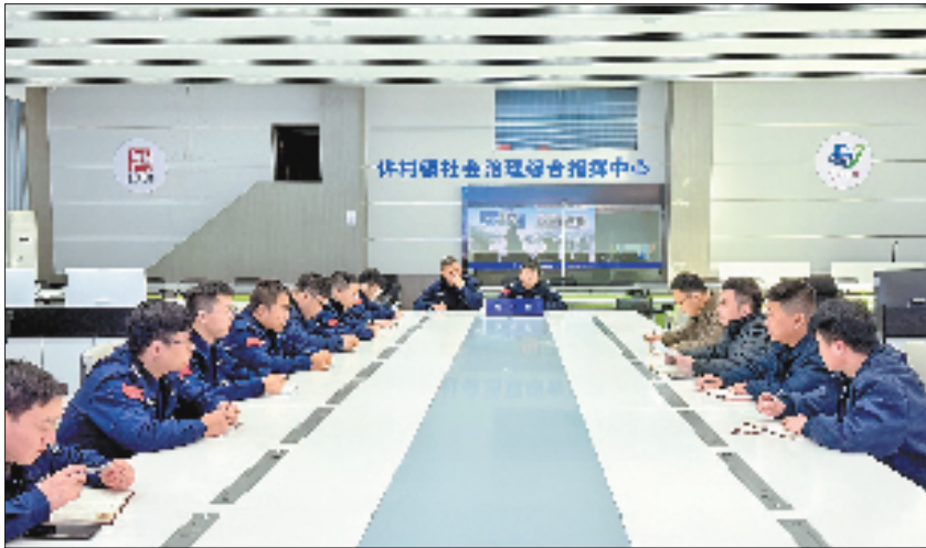
许村镇民声服务队进行专项培训

科技创新不是企业的独角戏，是生态协同的“团体战”。大会指出，将科技创新作为“立区之本”，矢志不渝，久久为功，共同点亮科技创新的璀璨星河。