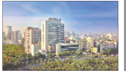
嘉兴市第二医院院区

术、人才与科研方面的协作,致力于建设成为响应快速、技术过硬、覆盖浙北的区域性儿童创伤救治中心。