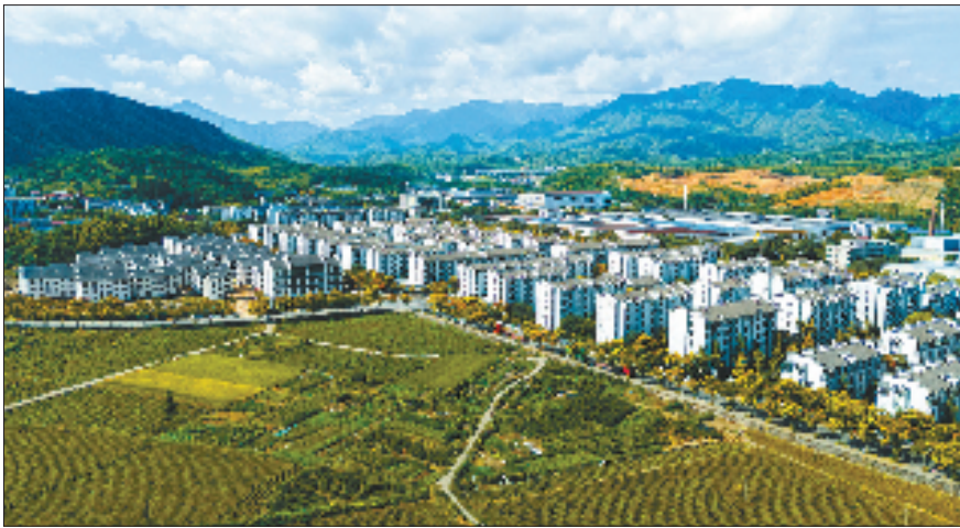
城乡要素双向流动的活水,正不断浇灌出龙游共同富裕的新图景。