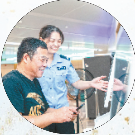
龙游县持之以恒推进基本公共服务一体化试点工作

站在“十四五”收官与“十五五”启幕的历史节点,龙游将继续锚定“区域明珠城市”目标,以“缩小三大差距”为主攻方向,在共同富裕示范区建设中勇毅前行,力争为全省高质量发展贡献更多具有龙游辨识度的标志性成果,让浙西明珠在新征程上绽放更耀眼的光彩。