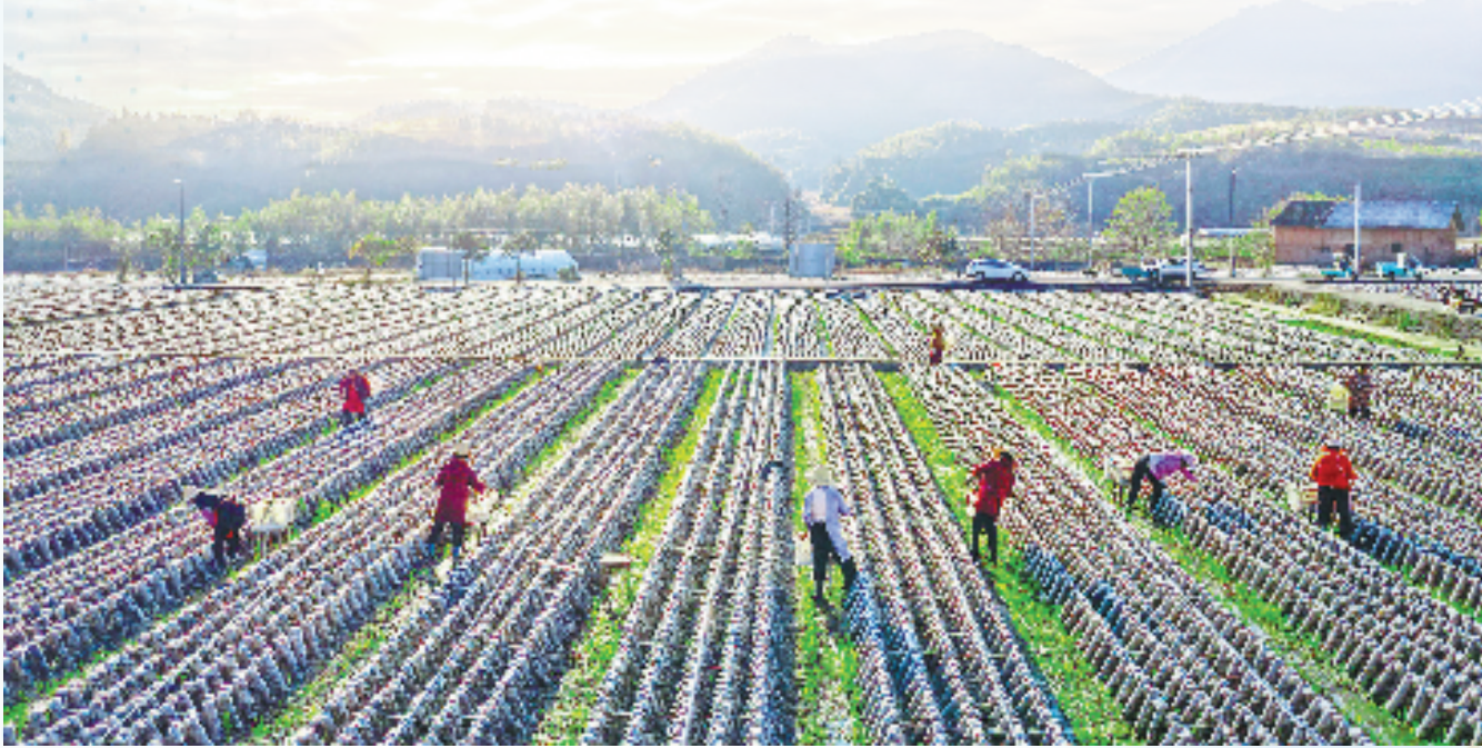
竹垟畚族乡黑木耳基地