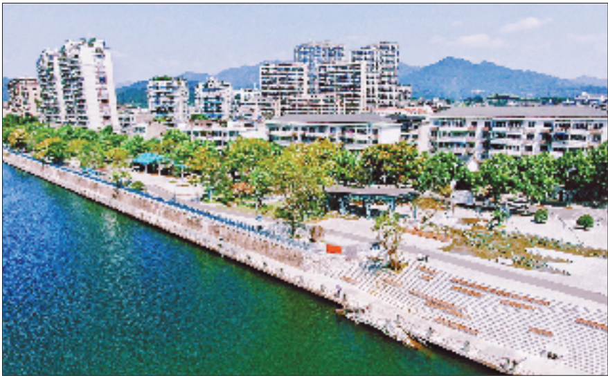
融入龙泉青瓷元素，打造瓯江北岸沿岸景观带。