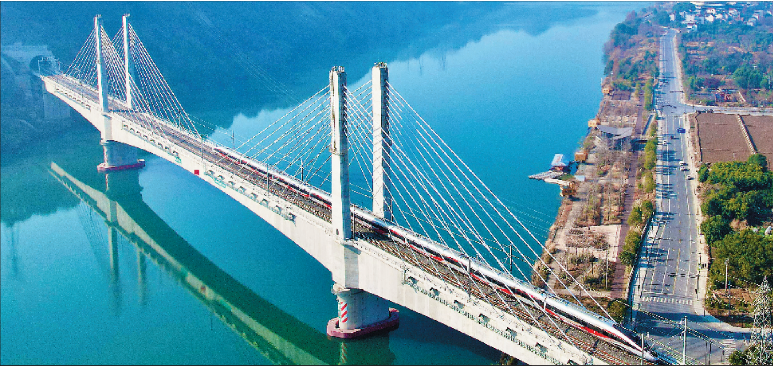
12月26日,杭衢高铁首趟始发列车C3132次复兴号动车组经过建德新安江特大桥。

12月26日9时16分,迎着冬日的朝晖,C3132次首发列车载着旅客与期待驶离衢州西站,向杭州方向疾驰,标志着杭衢高铁正式开通运营。 这条钢铁长脉贯穿杭州建德市,衢州龙游县、衢江区、柯城区,江山市,以350公里的时速重塑浙西发展格局。它的开通使常山、开化两个山区县进入“高铁时代”,这也标志着衢州实现“县县通高铁”。它不仅是一条轨道,更是一条被寄予厚望的浙西新动脉,加速着人流、物流与机遇的奔涌交汇。 杭衢高铁被誉为“移动的旅游走廊”——它让“快旅慢游”成为现实,周末一张车票,便能穿梭于西湖的诗意与江郎山的雄奇之间,品尝西湖醋鱼的酸甜和开化清水鱼的鲜美。 杭衢之间,风景从此在路上,生活在别处亦在眼前。