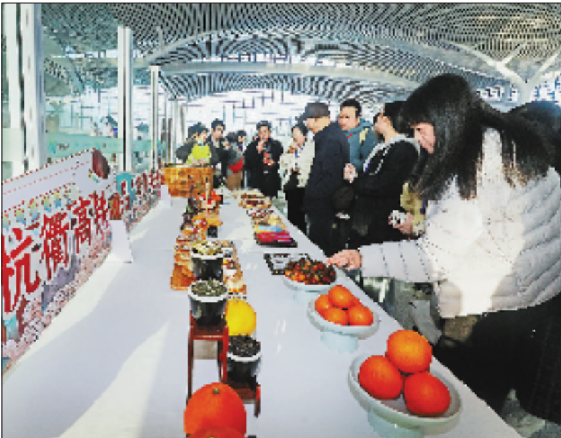
旅客们在衢州西站大厅里品尝当地特色小吃。