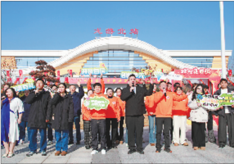
杭衢高铁开通首日,龙游北站举行快闪活动。