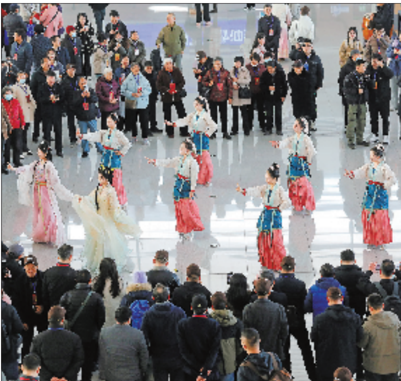
衢州西站候车大厅内,乘客正在观看文艺表演。