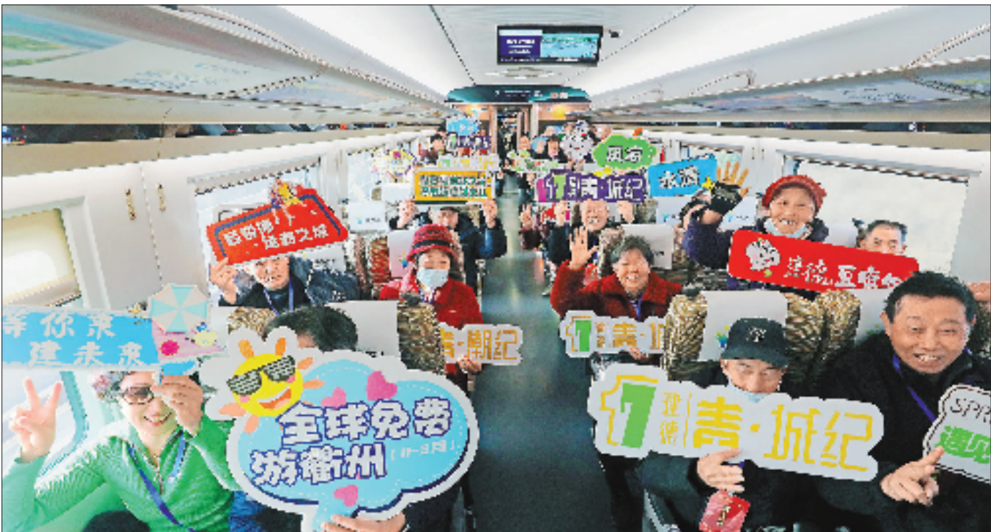
旅客们在车厢里合影留念,记录下这颇具意义的时刻。

12月26日9时16分,迎着冬日的朝晖,C3132次首发列车载着旅客与期待驶离衢州西站,向杭州方向疾驰,标志着杭衢高铁正式开通运营。 这条钢铁长脉贯穿杭州建德市,衢州龙游县、衢江区、柯城区,江山市,以350公里的时速重塑浙西发展格局。它的开通使常山、开化两个山区县进入“高铁时代”,这也标志着衢州实现“县县通高铁”。它不仅是一条轨道,更是一条被寄予厚望的浙西新动脉,加速着人流、物流与机遇的奔涌交汇。 杭衢高铁被誉为“移动的旅游走廊”——它让“快旅慢游”成为现实,周末一张车票,便能穿梭于西湖的诗意与江郎山的雄奇之间,品尝西湖醋鱼的酸甜和开化清水鱼的鲜美。 杭衢之间,风景从此在路上,生活在别处亦在眼前。