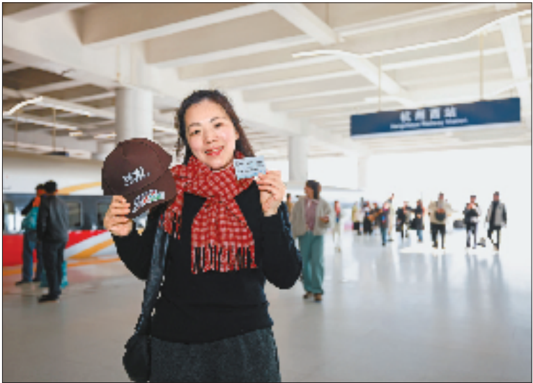
乘坐衢州首发列车的旅客抵达杭州西站。