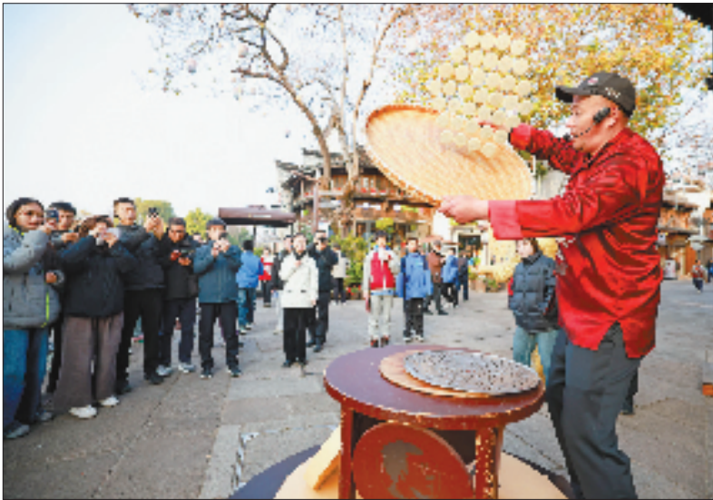
衢州市柯城区水亭门景区,游客们在观赏特色美食“永丰麻饼”的制作过程。