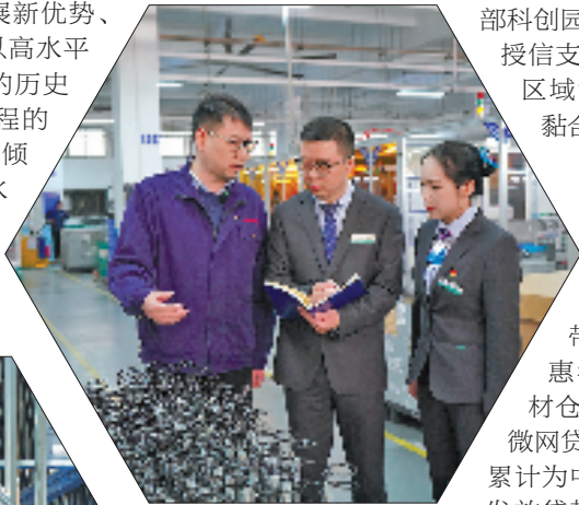
金融支持块状经济发展

潮涌之江风正劲,奋楫扬帆启新程。过去五年,农行浙江省分行是浙江经济大省挑大梁的亲历者、建设者、见证者;未来5年,有信心更有底气,以国有大行的贡献与担当,再续浙里华章,共赴下一程光景。