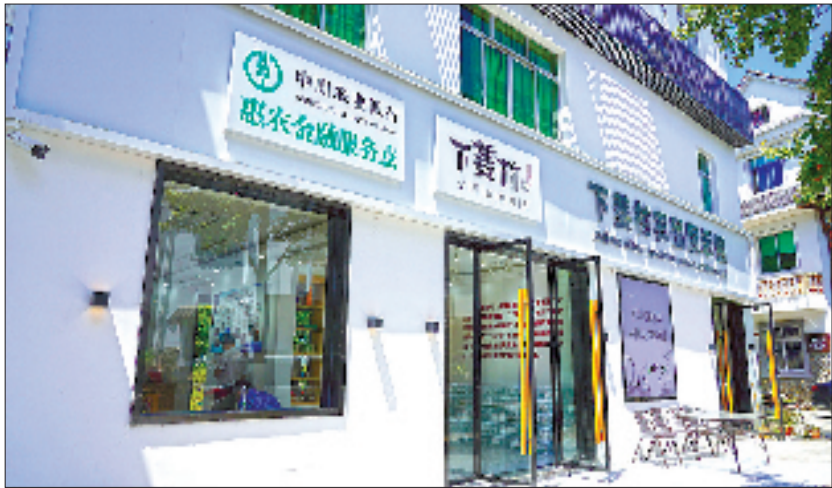
农行惠农金融服务点开进杭州淳安下姜村农产品展示馆

“十四五”时期,浙江经济总量连续跨越7万亿、8万亿、9万亿元三个大台阶,作为服务区域经济的国有银行,农行浙江省分行始终与浙江发展并肩前行。既“支早支小”,以首贷户、信用贷、中长期贷款精准滴灌初创企业,又助力“做大做强”,通过信贷、债券、股权“三支箭”齐发,推动民企转型升级、上市发展,托举民企攀登发展高峰;既倾力“纾困解难”,全面深化无还本续贷服务,又着力“提质增效”,实现线上贷款首家突破6500亿元,近3年为民营小微企业降息减费超35亿元,以真金白银传递金融温度。