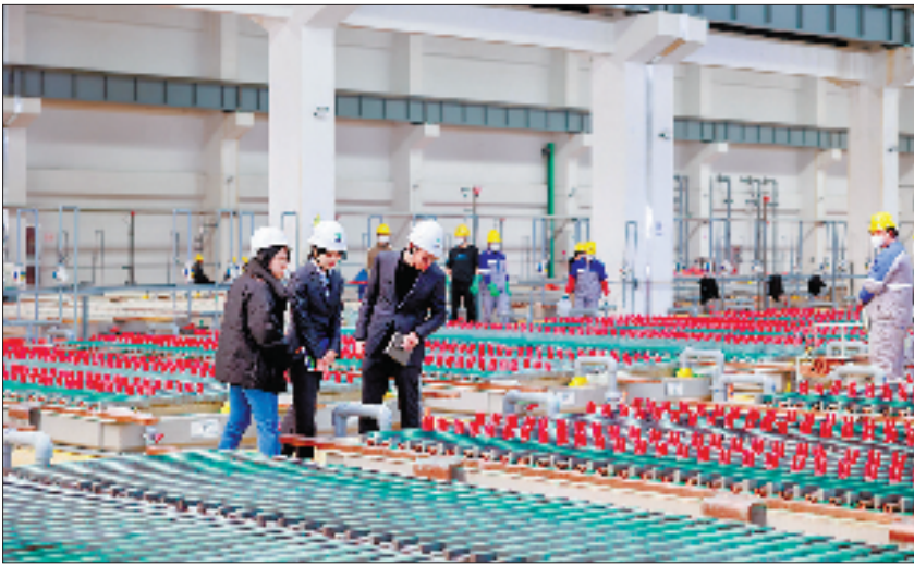
为民企锂电池新材料产业基地项目建设提供金融支持

省分行的金融活水也浇灌着民营经济的沃土,支持其由“生力军”成长为“主力军”,连续6年获评“民企最满意银行”。