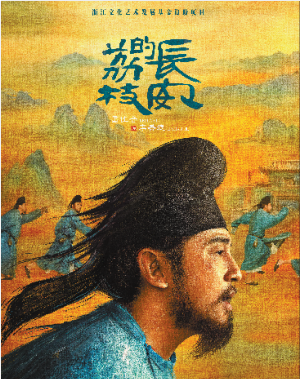
电视剧《长安的荔枝》海报。

2022年,环境式越剧《新龙门客栈》进入创作阶段,项目出品方百越文化创意有限公司申报了当年度的浙江文化艺术发展基金。