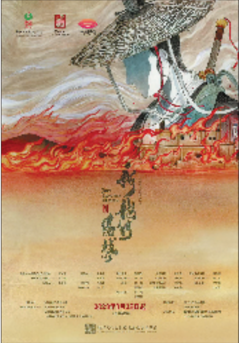
环境式越剧《新龙门客栈》海报。

在基金管理中心与省委宣传部、省文联等相关部門介入协调后,僵局迅速被打破。首先是资金支持,为展览的前期筹备和后期落地提供了关键的保障;更关键的是“政府主导”模式