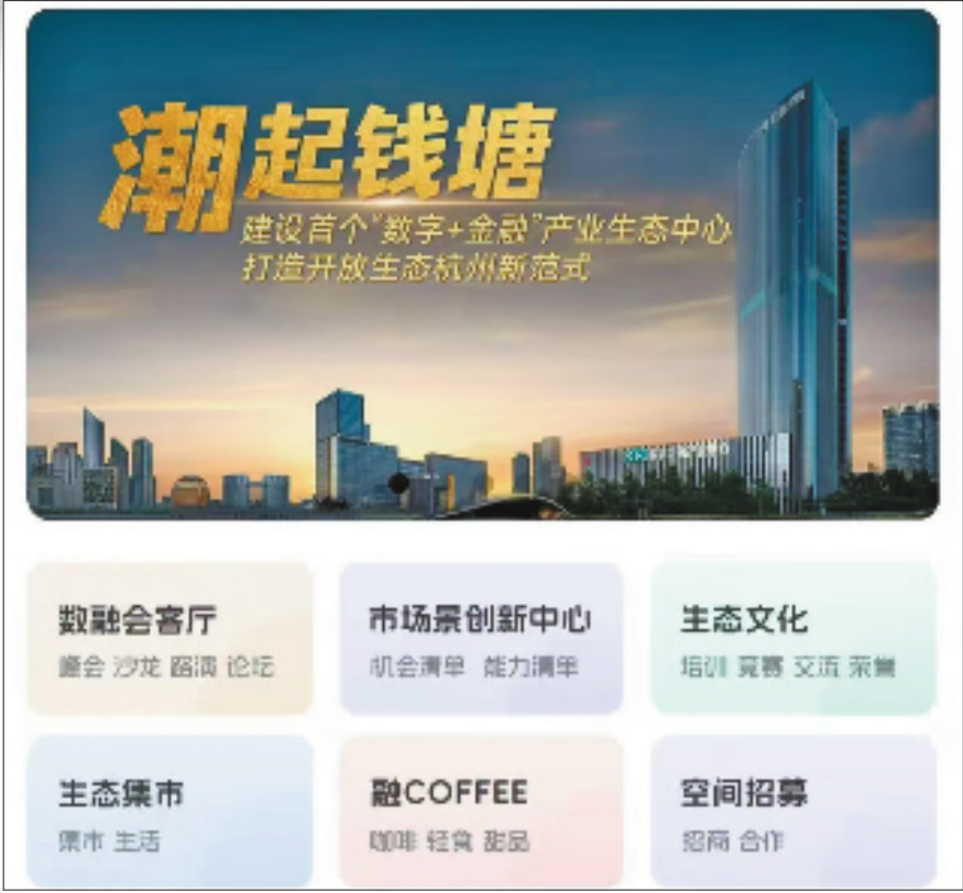
杭州金投“线上会客厅”

在产业生态中心正式发布的“杭创E站”，则汇聚“投、贷、补、担、保”五大资金要素服务和X项增值服务，旨在为科创企业提供“多样性”金融新产品、“一站式”融资新体验、“一揽子”财金新举措和