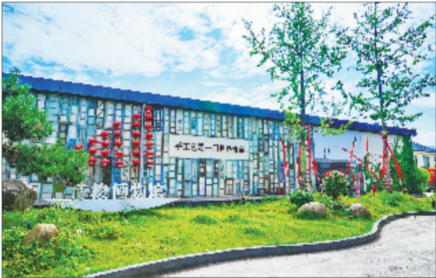
百尧镇乡村博物馆

“一老一小”服务不断完善。余杭构建普惠性育儿支持体系，92家社区婴幼儿成长驿站成为群众“家门口”的科学育儿平台，有效缓解“育儿难”问题。同时，全方位提升养老服务能力，建成12个镇街级示范型百岁幸福家，成功创建全国示范性老年友好型社区3个，市级老年友好社区16家。