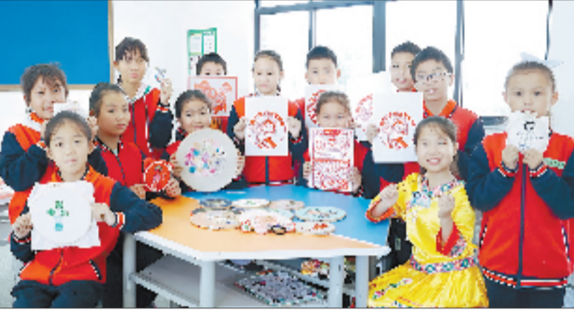
奉化区峙山小学入选浙江省第一批“共同富裕实践观察点”