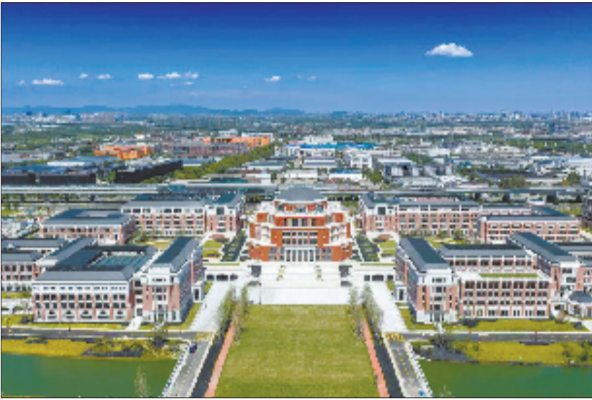
宁波东方理工大学校园

这份安心，也从校园内延伸至上学路。鄞州区惠风书院路口设有“一平米博物馆”，三星堆青铜器、良渚玉琮等图