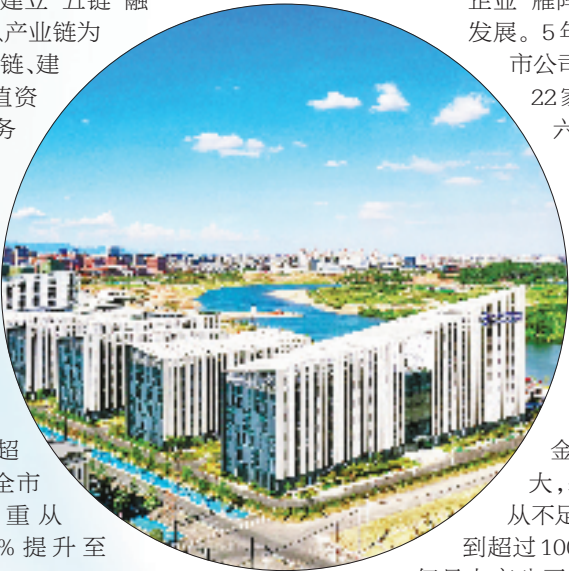
浙江大学衢州研究院

展望“十五五”，衢州仍要以发展新质生产力为引领，持续深入打好“五链”融合组合拳，加快推动“工业强市、产业兴市”取得新突破、攀新高，着力营造“引得进、带不走、压不垮、长得大”的一流产业生态，努力跻身全国城市先进制造业