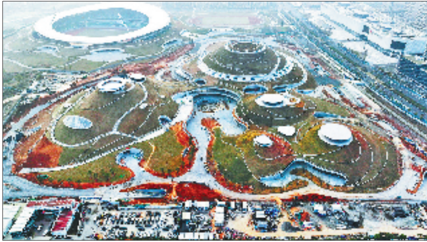
省第十八届运动会的重要赛事场馆——衢州市体育中心游泳馆、体育馆、综合训练馆初露雄姿。