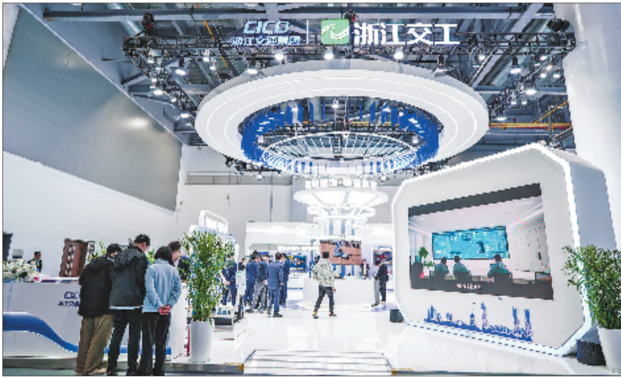
第七届浙江国际智慧交通产业博览会浙江交工展厅

“我们聚焦桥梁、隧道等核心施工领域,持续推进装备大型化、专用化、智能化升级,提升施工安全与效率。”现场解说员介绍,这些装备大多获评浙江省首台(套)产品,累计拥有数十项发明专利,整体技术达到国际领先或先进水平。