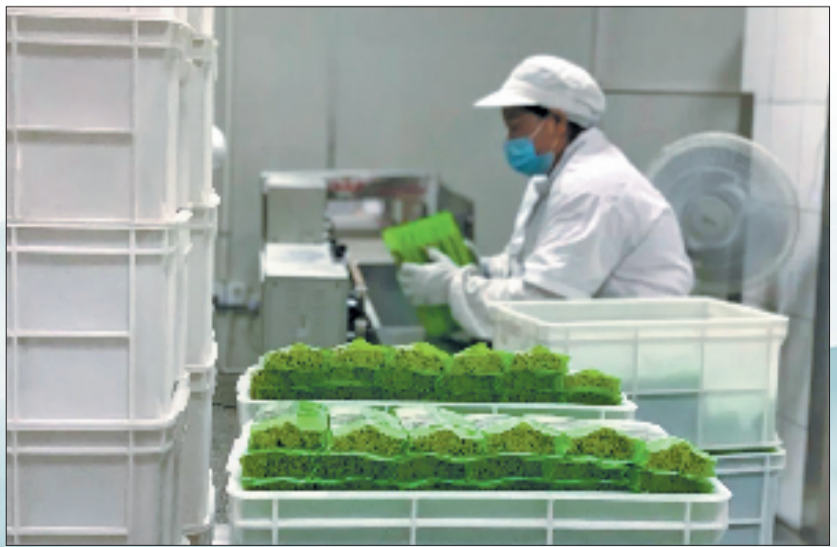
在工行萧山分行1000万元“网贷通”及配套结算业务的支持下,杭州兴旺食品有限公司拓展市场的步伐更加稳健。