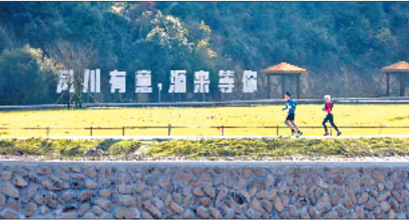
在赛道上奔跑的越野赛选手

桐庐100越野赛的辐射效应,正从基础设施、特色产业、就业保障多维度重塑凤川街道乡村发展格局。为保障千人规模赛事顺利举办,凤川街道针对性推进赛事途经区域基建升级。乡村小道拓宽硬化后,既保障选手通行安全,更破解了村民“出行难”问题。硬件设施迭代进一步激活翔岗古村文旅价值——选手及家属拍摄的古村体验内容年均获超300万次平台浏览量,2024年七八月份,以翔岗古村为核心的凤川