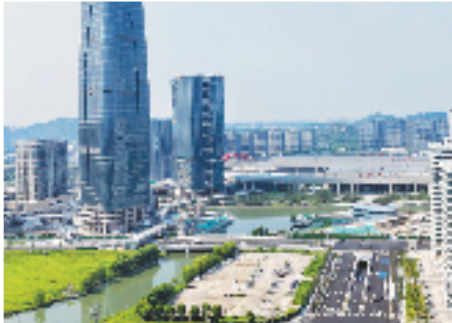
高铁绍兴北站TOD综合体。

面对优势企业增资扩产的空间需求与土地资源紧约束的现实矛盾,绍兴市推出“二次开发”模式,鼓励企业“零增地”或“少增地”,向空中要空间。政策明确,工业项目在不新增用地前提下,通过拆除重建、开发地下空间、增加建筑层数等方式实现空间扩容的,不