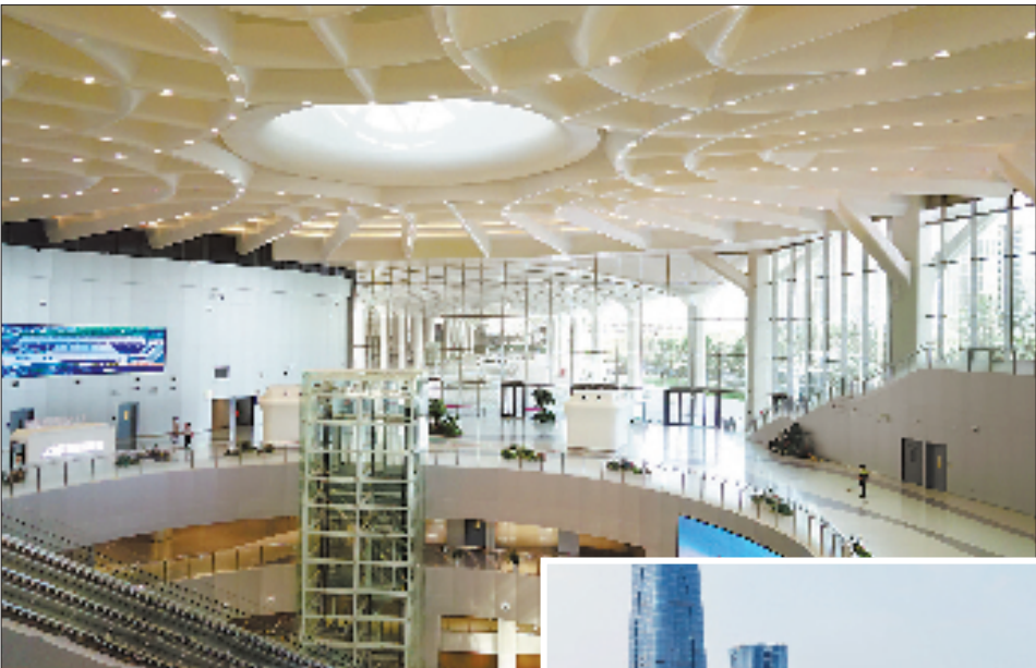
■ 通讯员 李风 柳栖横 记者 余丽

浙江省“十五五”规划建议提出,推进存量空间提质增效。而这一省级战略的探索实践,正在绍兴有序展开。