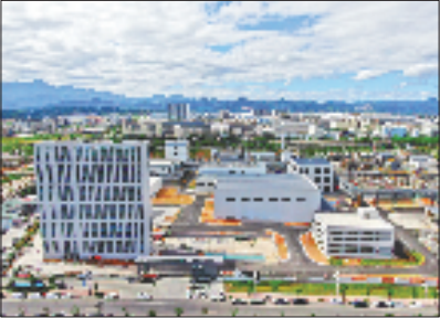
拓烯二期高端光学新材料项目