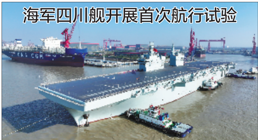
11月14日9时许,我国076两栖攻击舰首舰四川舰从上海沪东中华造船厂码头解缆启航,赴相关海域开展首次航行试验任务。

陈斌华强调,台湾问题事关中国核心利益和全体中国人民的民族感情。我们有坚定意志、坚强决心、强大能力,粉碎一切“台独”分裂行径和外来干涉,捍卫国家主权和领土完整。无论外部势力如何捣乱,中国终将统一、也必将统一的历史大势不可阻挡。希望广大台湾同胞充分认清相关行径的危险性、危害性,同我们一道守护中华民族共同家园,维护中华民族根本利益和自身安全福祉。