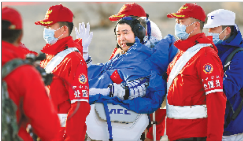
航天员陈冬安全顺利出舱。

据介绍,从按下“暂停键”到返回任务重启,中国载人航天工程秉持“生命至上、安全第一”理念,立即启动应急预案和措施,各系统迅速反应、团结协作、扎实应对,最终决定先让神舟二十号航天员乘组乘坐神舟二十一号载人飞船返回东风着陆场,后续再择机发射神舟二十二号载人飞船。