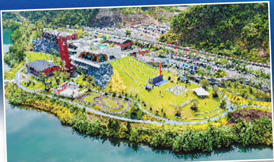
水之极综合性潜水运动基地位于新安江畔。