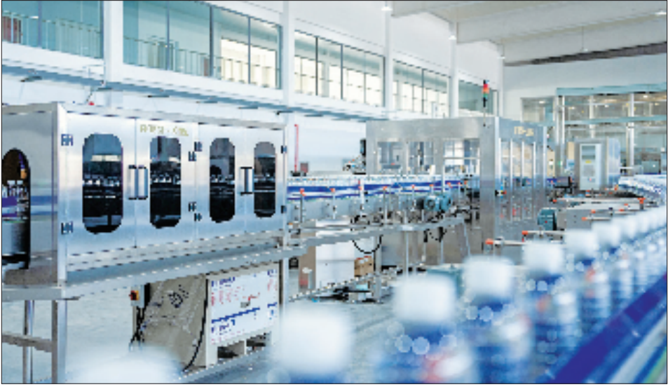
龙泉查田镇的“丽水山泉”矿泉水生产基地,一条条自动化生产线高速运转。