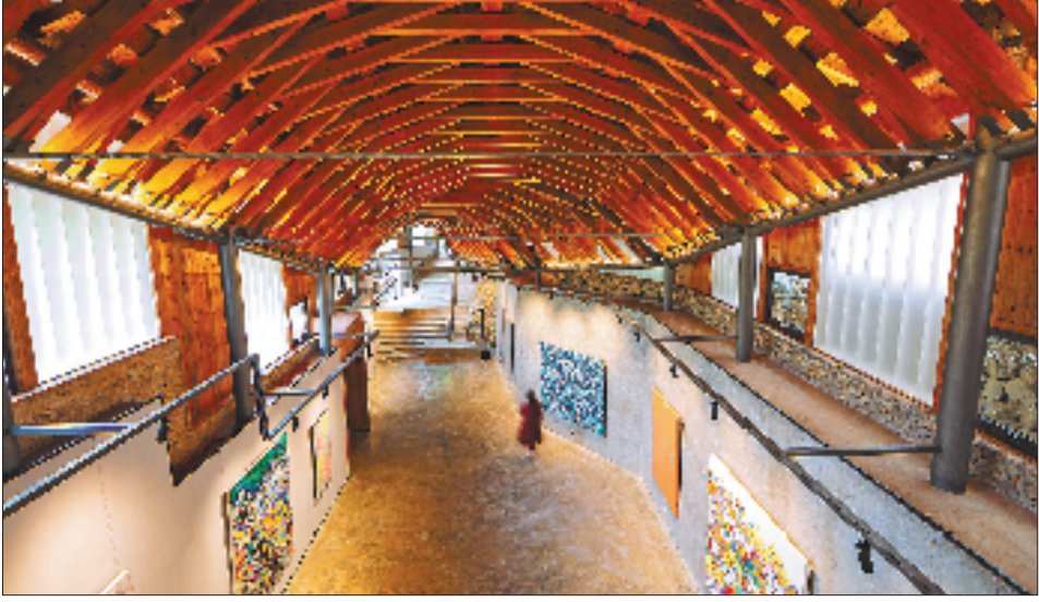
松阳县叶村乡横坑村玖层美术馆内部。