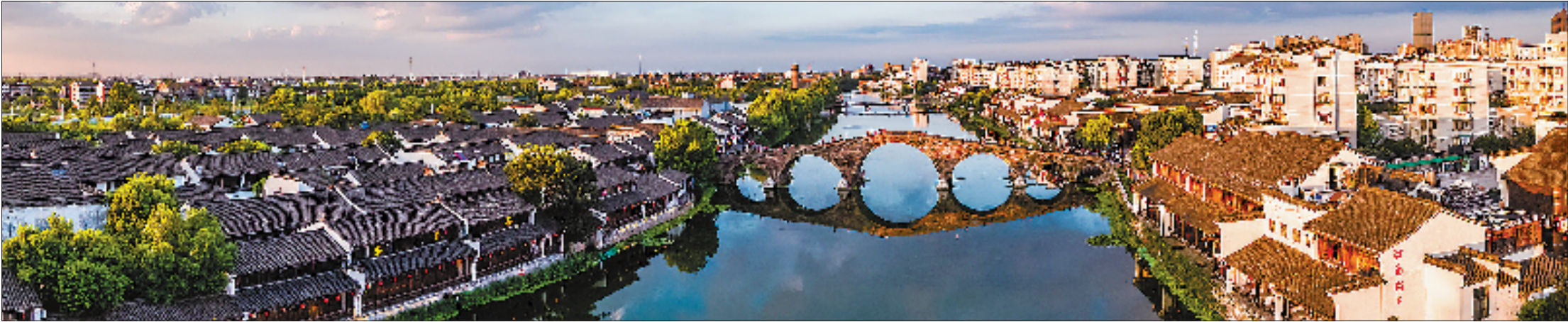
广济桥作为大运河遗产点被列入《世界遗产名录》。

古代中国人为什么要创造出大运河?这其实是人与自然关系的“重构运动”。 从自然条件的角度看,在8000万年前到300万年前之间,发生了一场喜马拉雅造山运动。这次造山运动导致了我国及周边国家的自然大河与地貌及生态格局的形成。长江、黄河作为中华民族与中华文明的母亲河,它们从西向东并在相近的纬度上流淌,而古巴比伦文明、古埃及文明、古印度文明的“母亲河”皆南北流向且跨越了较大的纬度。这是古中国文明与上述三个世界原生文明不同的地理生态背景,也是中华文明未曾断裂的自然动力支撑。 造山运动也导致中国形成了从西向东逐级降低的“三级阶梯”,使中国的平原集中在东部,西部以山地为主,从而导致了东、西部不同的自然条件和经济模式,加之气候、河流及海洋等自然要素的影响,最终形成了“胡焕庸线”现象,即东、西部地区社会发展的不平衡现象,90%以上的人口、城市和经济产出都集中在漠河到腾冲一线东南侧。 东西走向的长江、黄河、淮河等自然大河及其流域创造了古中国文明,给中华文明的不同经济文化板块提供了贯通东西的运动空间,但它也造成了不同经济文化板