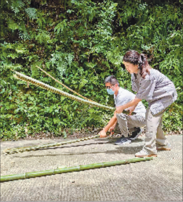
记者(右)学习摔竹子。

“宝弟”习惯玩弄的竹筒里塞着苹果块,轮胎做的秋千上藏着窝窝头,甚至木头躺椅下铺的都是松树皮,“踩上去软绵绵的,密度刚好能接住大熊猫打滚的力道。”为迎接两只大熊猫,让它们生活得更加舒适,工作人员动了不少脑筋。 看到“宝弟”表现良好,我的注意力