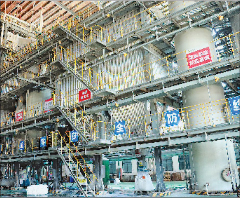
焚烧车间。

“巡检工不仅要主动发现问题,还要第一时间响应指令、精准调整,并确保效果。”他补充道,窑头是危废进入焚烧系