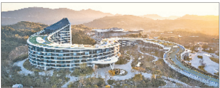
华东大峡谷数字创客基地。

一期已交付，每周都有免费班车往返于泰顺县城和瑞安市。这个夏天，不少新雅阳居民隔三岔五就会跑来避暑：“晚上坐在家里面吹吹自然风就很舒服，根本不需要空调”……面对雅阳新居民消费需求，政府主动添置了共享电动车，改造升级了当地菜场，就连老城区路灯改造、路面修整、房屋外立面改造等也逐步焕然一新。