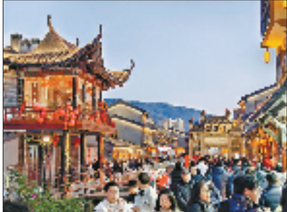
昆阳镇重铸文旅魅力内核，坡南街月均游客数超50万。

今年，昆阳镇进一步完善“大事共议、项目共建、利益共享”机制，让村社发展进入多种模式互为补充、协同的集团作战阶段。目前，陆续谋划片区项目140个，总投资16.4亿元。