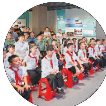
衢州杜立特行动纪念馆,社会各界人士现场收看直播。

本报衢州9月3日电 (记者 于山 魏志阳) 3日上午,位于衢州的杜立特行动纪念馆内气氛庄重热烈。杜立特行动历史研究会代表、学生