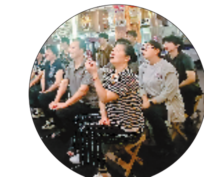
参与“里斯本丸”营救事件渔民后代和当地群众收看直播。

本报舟山9月3日电 (记者 黄宁璐 共享联盟·普陀 高洁) 3日,当清晨的阳光洒向海面,舟山市普陀区东极镇庙子湖岛上的“里斯本丸”营救事件纪念馆便热闹起来,参与“里斯本丸”营救事件的渔民后代和当地