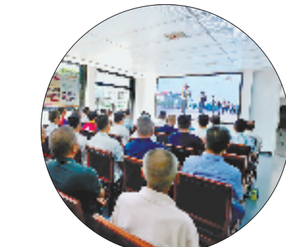
在余姚横坎头村党群服务中心,干部群众收看直播。

本报宁波9月3日电 (记者 陈舸 通讯员 高嘉鸣) 3日上午9时,宁波余姚横坎头村党群服务中心,挤满了前来收看纪念大会直播的革命老区干部群众。