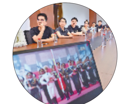
浙江大学历史学院师生收看直播。

本报杭州9月3日讯 (记者 王雨红 通讯员 陈琛夏) 3日上午,浙江大学历史学院一间会议室里掌声、欢呼声、赞叹声此起彼伏,师生们兴奋地守着大屏幕收看纪念大会直播。