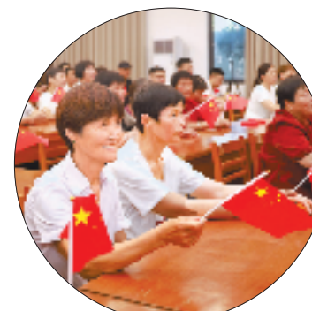
富阳受降村村民在村文化礼堂收看直播。

本报杭州9月3日讯 (记者 赵路 通讯员 童林珏) 3日一早,位于杭州市富阳区银湖街道的受降村,村民们陆续到达村委门前的空地。8时50分,庄严的国歌响起。银