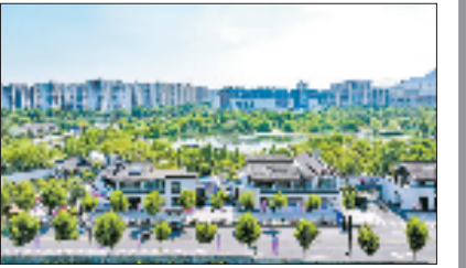
丁兰街道航拍图

景。在这里,传统文化与现代治理相互交融,不仅留住了淳朴温馨的“乡愁”,更激发了居民共同建设美好家园的参与感与创造力,让“都市新桃源”这张金名片,不断绽放新的光彩。