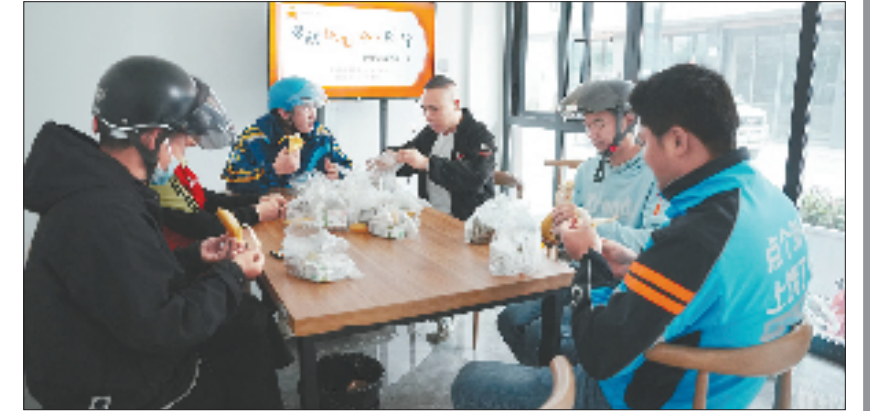
武原街道打造的24小时不打烊的“文昌驿”服务驿站。

题,武原街道聚焦新就业群体现实需求,联合多方力量打造一站式服务驿站,构筑起覆盖全域的暖心服务网络,切实改善了新就业群体的工作条件。武原街道协同县委社会工作部与县总工会共同打造了24小时不打烊的“文昌驿”服务驿站。驿站提供休息歇脚、免费饮水、充电热餐及友好生活地图等一站式便利,成为穿梭于城市街巷的劳动者们“不停歇的加油站”。目前,像“文昌驿”这样的服务驿站,海盐县已建成111家,其中24小时开放站点达8家,而这张暖意绵延的服务网络仍在不断延伸中。