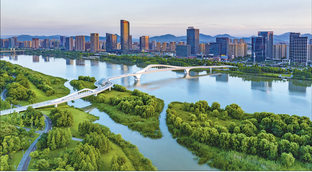
上虞区曹娥江畔的自然风光与城市景观融为一体。

目前,上虞一江两岸核心区已汇聚21个总部楼宇项目,其中已完工建成大楼6幢,在建大楼13幢,本年新开工大楼2幢,一幅产城人文融合的滨水青春之城图景已徐徐展开。