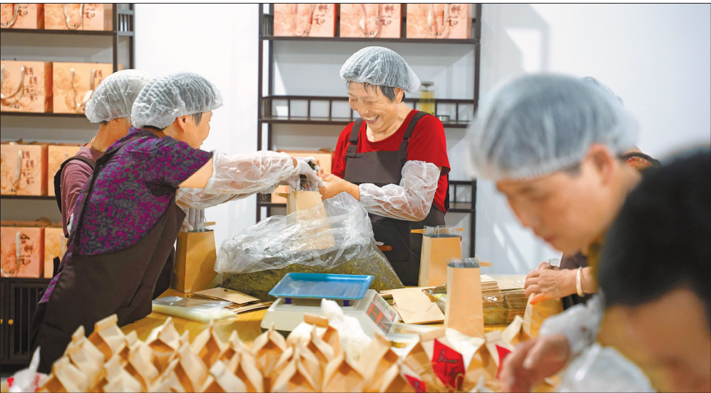
柯桥区平水镇的松盛园乡创飞地中,工作人员在打包农产品。

产业发展、城市建设,最终的落脚点在人,在于百姓的获得感和幸福感。店口镇党委书记张营表示,这份因环境改善而凝聚的人心之力,将化作高质量发展的强劲动能,推动店口在绿色转型的道路上继续前行。