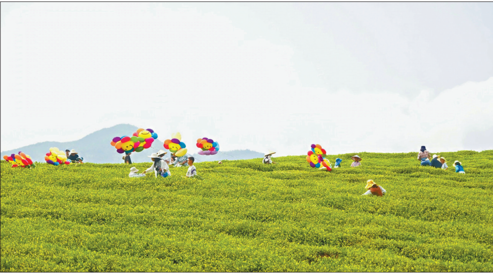
游客在嵊州市贵门乡体验茶叶采摘,亲近自然风光。