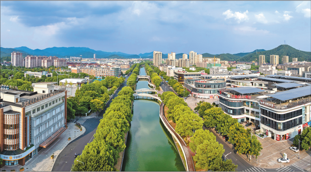
生态宜居的诸暨市店口镇。