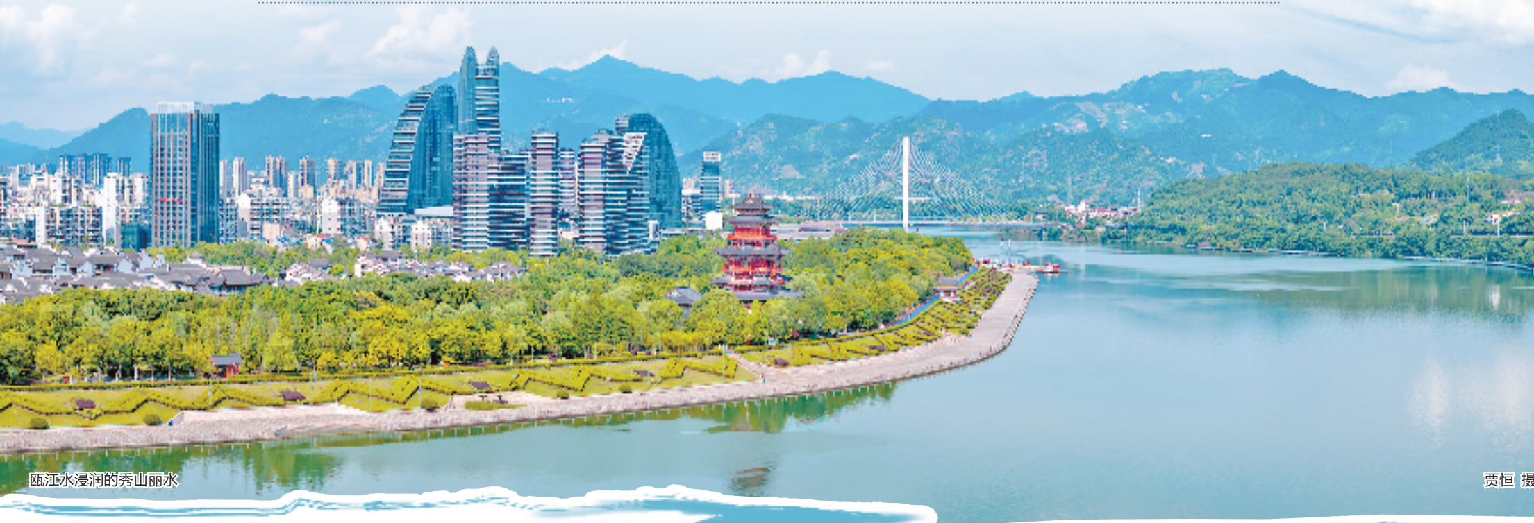
瓯江水浸润的秀山丽水

在时代的卷轴中，丽水以创造性实践书写绿色发展的改革答卷。生态环境状况指数连续20年排名全省第一，成为全国唯一空气、水环境质量均跻身前十的地级市，全市GDP年均增速超过10%，“绿色发展标杆地、秀山丽水活力城”逐渐神形兼备。