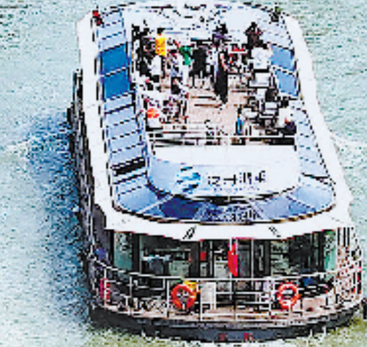
京杭大运河杭湖游线上,“魏桂汉宫”号游船途经杭州拱宸桥。