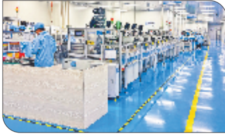
工行整合集团资源,为国家重点高新技术企业三花集团提供综合金融服务,助其全球化布局。