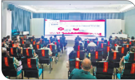
入园区、进工厂,工行积极开展多维度、深层次的宣导工作,为我省外贸企业提供汇率避险辅导,助力实体经济行稳致远。