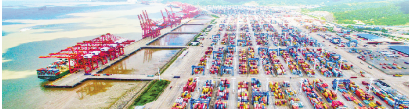
工行加力推进宁波舟山港向世界一流强港迈进

在产品端,为外贸相关企业提供涵盖国际业务、公司业务、普惠业务、投行业务等多个维度的专项产品。针对中大型企业,配备项目贷款、流动资金贷款、并购贷款等,帮助外贸企业调整国内生产链、扩产能和满足企业海外建厂等一系列性资金需求。在助力小微企业成长方面,工行推出新一代“经营快贷”,单户融资额度最高可达500万元;对有厂房购置、建设等需求的小微企业,提供“厂房购建贷”,实现普惠金融对小微外贸企业的精准滴灌。在国际业务方面,聚焦跨境融资、汇率避险及国际结算,推出特色零成本期权,积极推进政策性担保公司提供担保,推广中小外贸企业汇率避险期权费用政策补助的产品,进一步提升企业