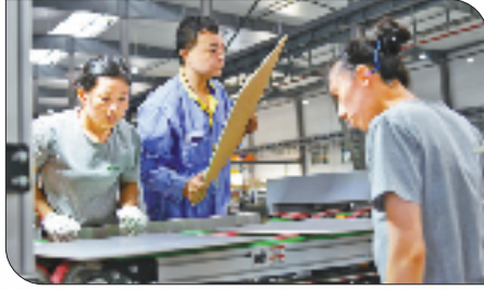
工行为浙江巨美科技股份有限公司落地境外标准银团贷款,金融助力高质量共建“一带一路”。