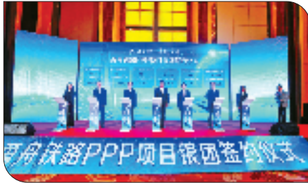
工行作为牵头行支持的甬舟铁路项目,是浙江省大通道建设十大标志性项目之一。

越是环境复杂多变,纾困解难方显金融温度。对于因关税影响出现暂时困难企业,工行浙江省分行坚持“三不”原则——不抽贷、不压贷、不断贷,同时精准匹配“无还本续贷”等一揽子政策工具,助企业稳舵前行。截至6月末,该行累计为外贸企业发放续贷资金超80亿元。这份强有力的金融后盾,既让企业“出海”扬帆时安心无虑,更赋予其开拓国内市场的十足底气。