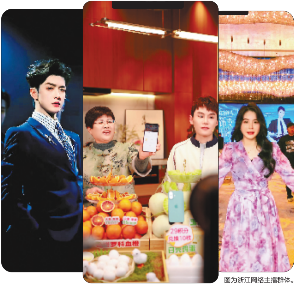
图为浙江网络主播群体。

这当中的例外,也许只有跳脱出对粉丝、流量焦虑的头部主播了。“主要靠运气,努力最多只能起一半的作用。”90后贵州男生余兆说。他更被人熟知的名字是拥有3400万粉丝的带货主播“多余和毛姐”。最初,他是一人分饰两角的短视频达人——2018年,戴着橘红色假发的“毛姐”以一句“好嗨哦,感觉人生已经到达了巅峰”的魔性语音被全网熟知,几个月内粉丝破千万;一年后,他跟着综艺节目走上第72届戛纳国际电影节的红毯。在这条新闻下,网友的讽刺和挖苦占满评论区,“网红也有资格来走戛纳红毯?”那是初代网红们带着粗粲与另类,挤占社交平台,创造财富神话的年代,而这样的暴富与曝光度,在网友看来似乎带着原罪。接下来几年,余兆和用沉默与忙碌的工作,消化掉了评论区的恶意,他也习惯于粉丝数缓慢下降的现状,直到2022年底,已“佛系