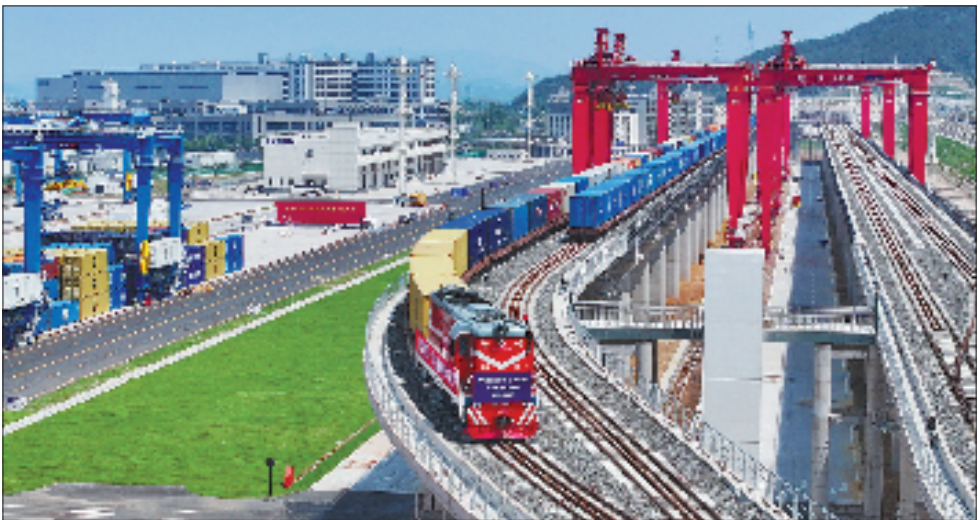
6月27日下午4时25分，义乌(苏溪)国际枢纽港一期正式运营。

浙中小镇苏溪，正成为世界最大的小商品集散中心义乌联通全球的桥头堡。6月27日下午4时25分，满载100个标准集装箱货物的81114次海铁联运班列从义乌苏溪集装箱办理站鸣笛启程，驶向世界第一大港宁波舟山港。 这标志着国内首个把海港港口功能全方位前置到内陆港区，实现港务、船务、关务一体化运行的陆港——义乌（苏溪）国际枢纽港一期正式运营，开启了义乌小商品由陆港直接运往全球的新航程。 高效联通 苏溪集装箱办理站是义乌（苏溪）国际枢纽港的一期项目，占地约943亩，总投资27.81亿元，于2022年11月开工建设，是省“十四五”综合交通发展规划的重点项目。 义乌“买全球、卖全球”，这些年货物出海