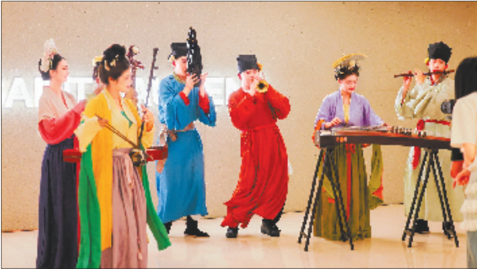
半塘欢喜国风乐团已数次在西子廊桥演出。