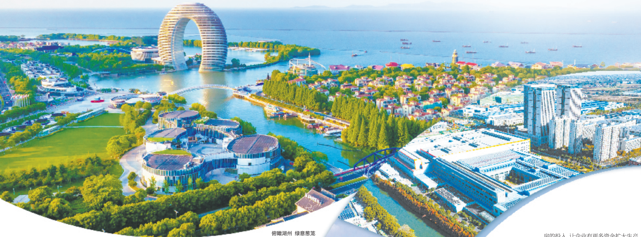
俯瞰湖州 绿意葱茏

初夏时节，万物并秀。5月10日，在绿意葱茏的太湖南岸，湖州未来大会如约而至，产业专家、行业精英以及青年人才汇聚一堂，把脉前沿、共话发展。