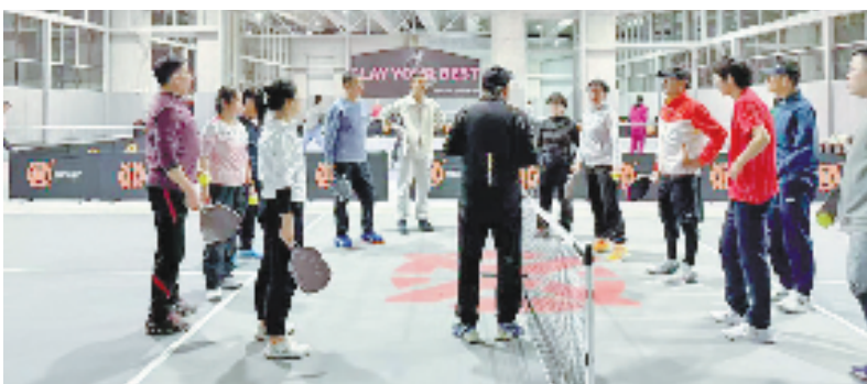
市民在众冠体育公园练习匹克球

在这个春暖花开的季节里,众冠体育公园正以一种全新的姿态迎接每一位热爱生活的市民。夜幕降临时分,桥上车辆川流不息,桥下灯火通明。这座建在交通动脉下的体育公园,正以独特的方式讲述宁波交通对于“文体融合”的积极探索与不懈努力。